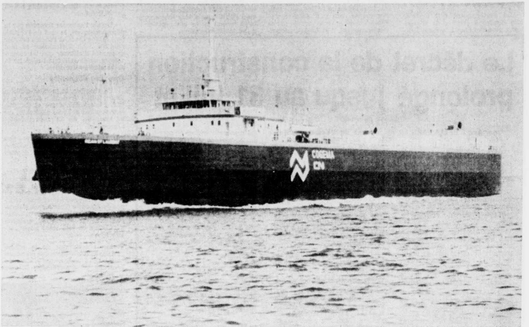
Le "Georges-Alexandre Lebel", en service depuis un an