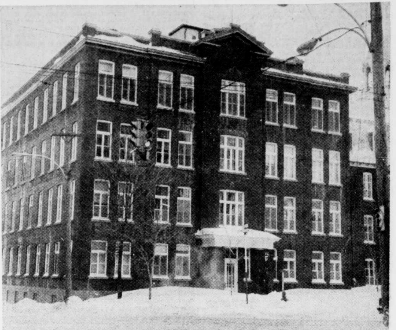
Il en coûterait $1.5 million pour transformer cette école en un complexe hôtelier pour personnes âgées à Thetford Mines.

Signalons que ce nouveau plan opérationnel sera en vigueur le 1er février prochain et le demeurera pendant la durée de la convention collective.