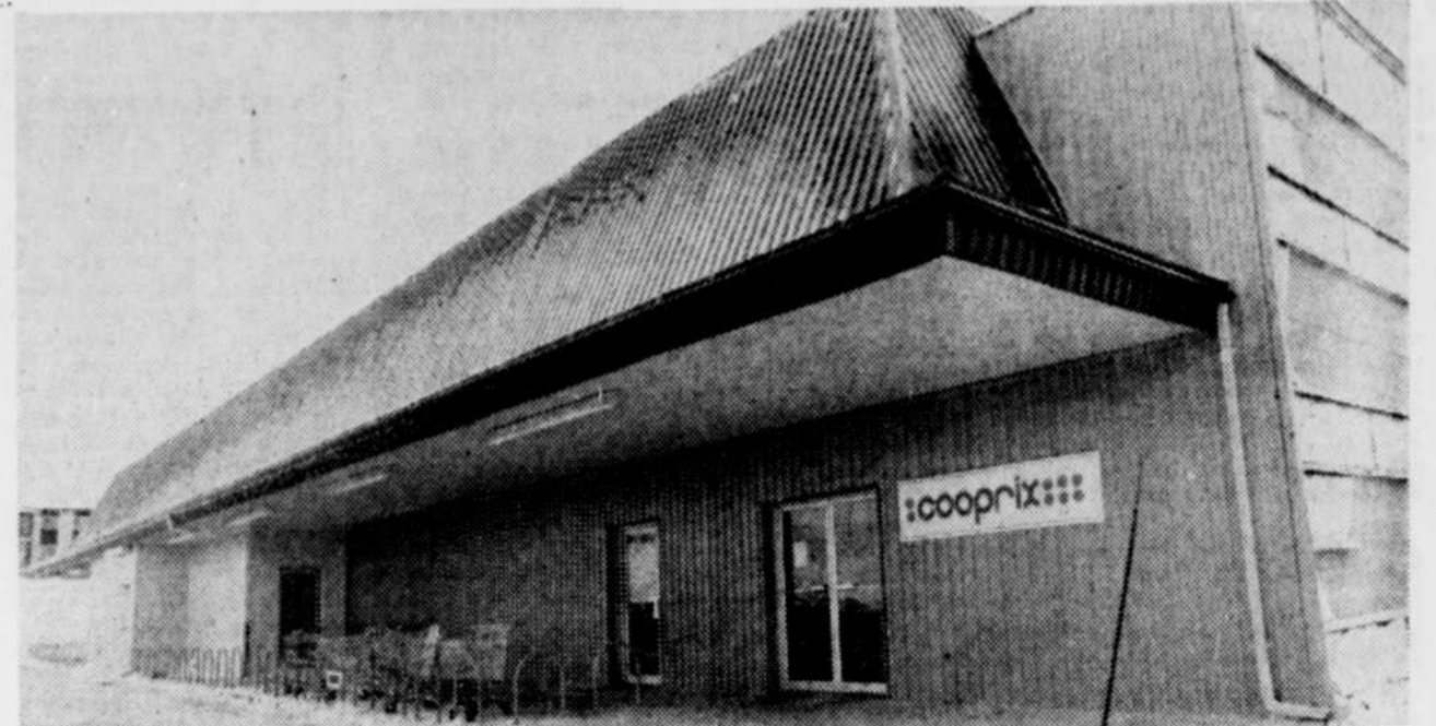
Le Cooprix de Sainte-Foy

D'abord, la loi 90 sur le zonage agricole prévoit des exceptions pour des édifices d'utilité communautaire, alors que la municipalité, avant même l'acceptation de la loi, avait déjà planifié son développement et installé ses services sur le territoire concerné.