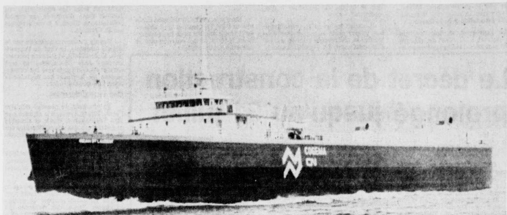
Le "Georges-Alexandre Lebel", en service depuis un an