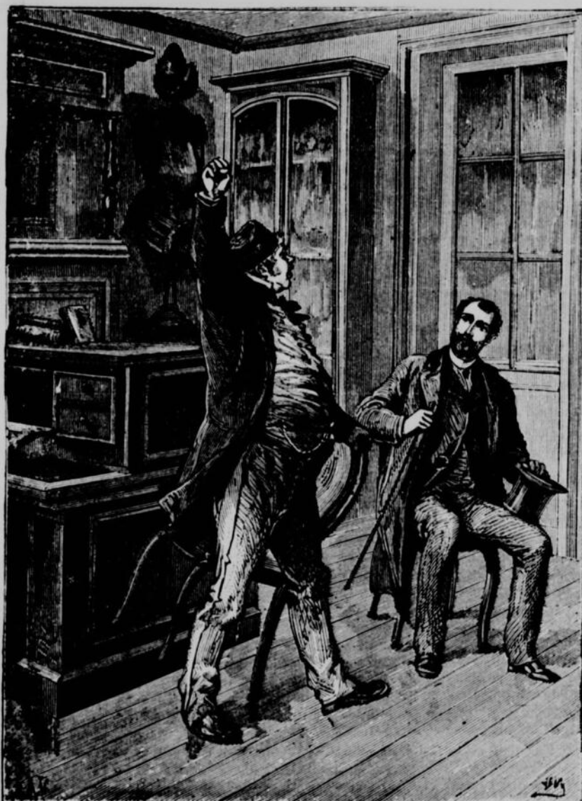
M. Millard leva le bras et lança au jeune homme un regard de malicieux dédain. — (Page 77, col. 1).

Voici ce qui avait donné lieu à cette première entrevue de Maurice avec M. Millard.