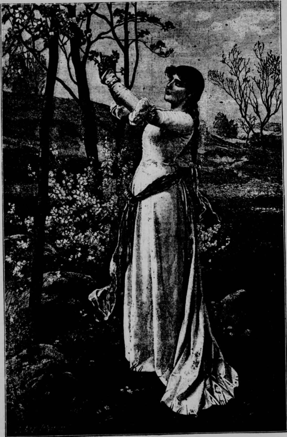
UN RAYON DE PRINTEMPS. — TABLEAU DE M. E. VICKYZ

La ligne, par insertion . . . . . 10 cents Insertions subséquentes . . . . . 5 cents Tarif special pour annonces à long terme