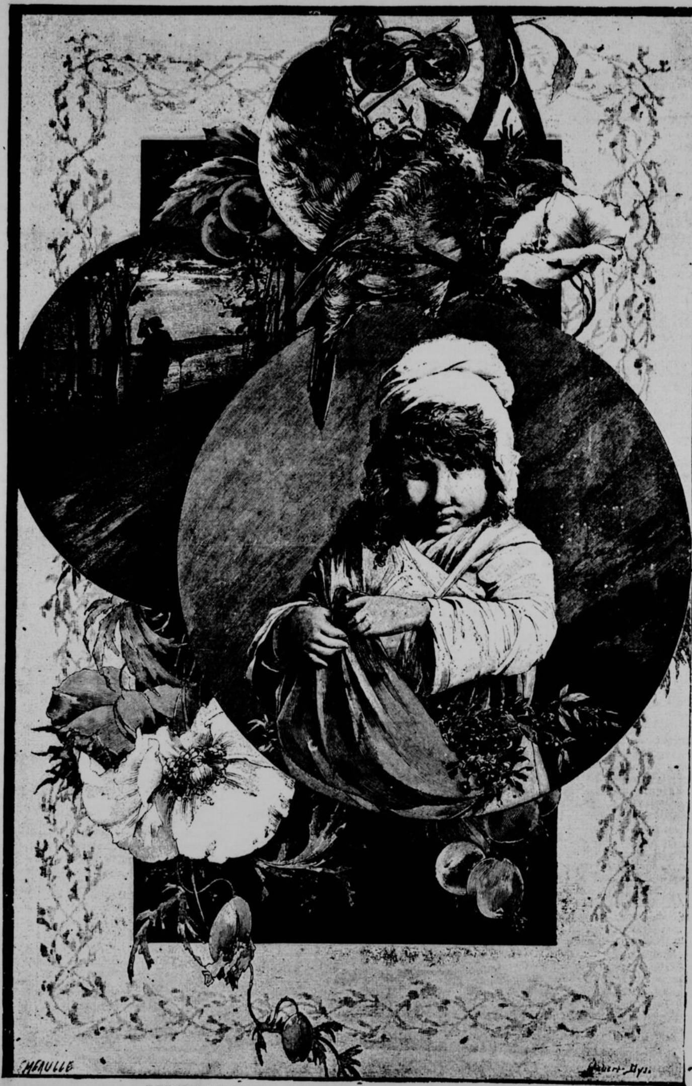
LES MOIS FLEURIS : JUILLET. — COMPOSITION DE M HABERT-DYS