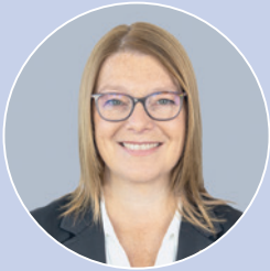
Nancy Blanchet Mairesse - Mayor