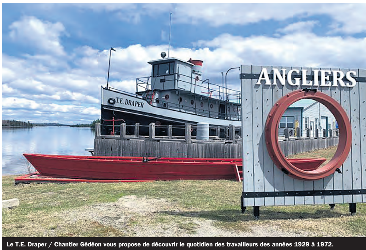
Le T.E. Draper / Chantier Gédéon vous propose de découvrir le quotidien des travailleurs des années 1929 à 1972.