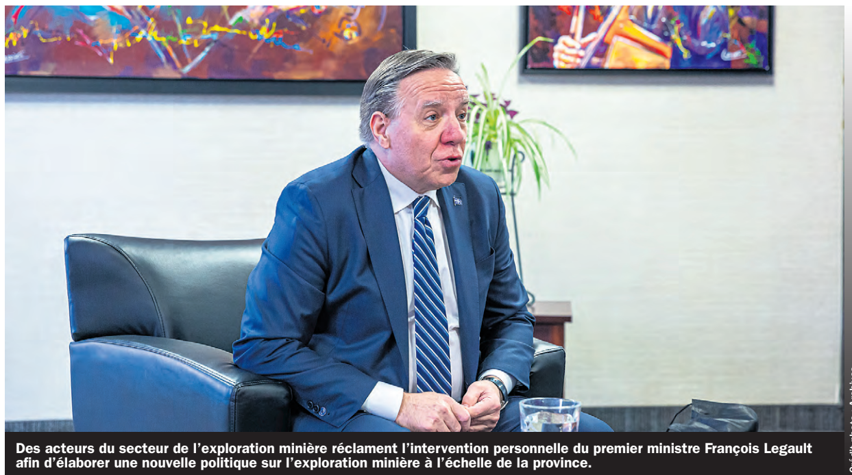
Des acteurs du secteur de l'exploration minière réclament l'intervention personnelle du premier ministre François Legault afin d'élaborer une nouvelle politique sur l'exploration minière à l'échelle de la province.