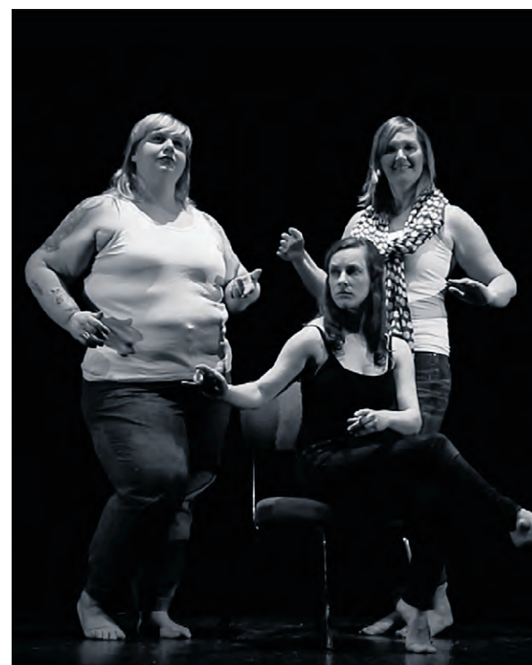
Les comédiennes du film sont des femmes originales de la région.

La présentation publique du film Image des femmes est complètement gratuite et ouverte à tous. Pour y prendre part, veuillez réserver votre place via la billetterie de l'Agora des Arts.