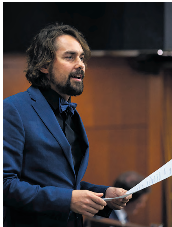
Le député bloquiste du comté d'Abitibi-Témiscamingue, Sébastien Lemire, se réjouit de l'augmentation des demandes de financement pour les projets destinés aux aînés dans la région.

Sébastien Lemire ajoute que le gouvernement fédéral cherche toujours des moyens de simplifier le processus de demande, soit la modification du formulaire à remplir par les bénévoles, une tâche qui s'avère encore lourde selon le député.