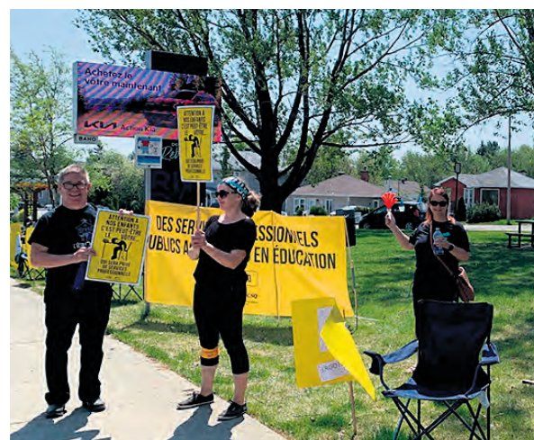
Des syndiqués affiliés au Syndicat des professionnelles et des professionnels en milieu scolaire du nord-ouest ont manifesté, mercredi le 31 mai, au parc Larivière à Rouyn-Noranda, afin de porter leur cause à la population.