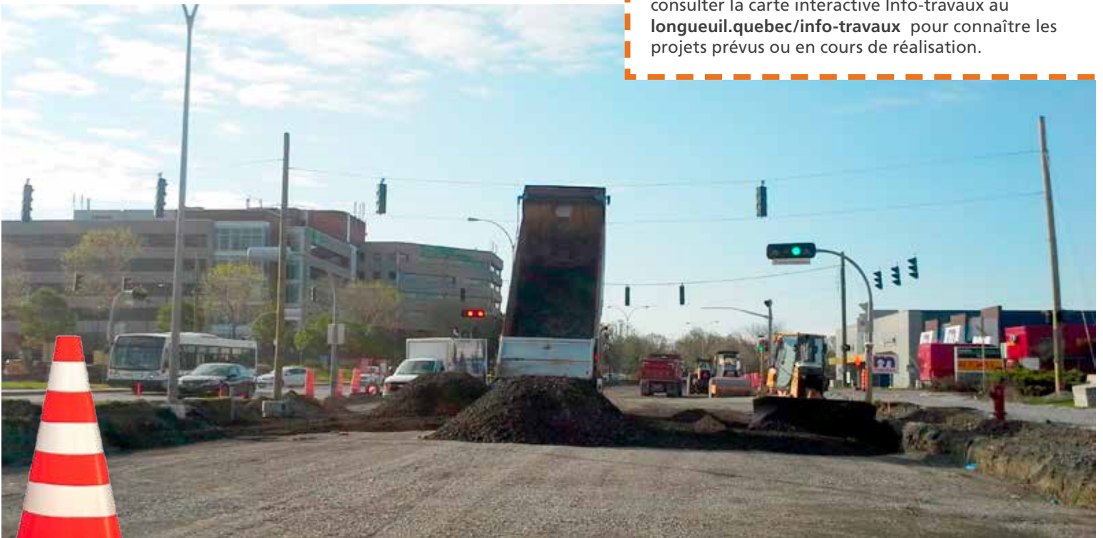
Travaux de réaménagement en cours – boulevard Roland-Therrien