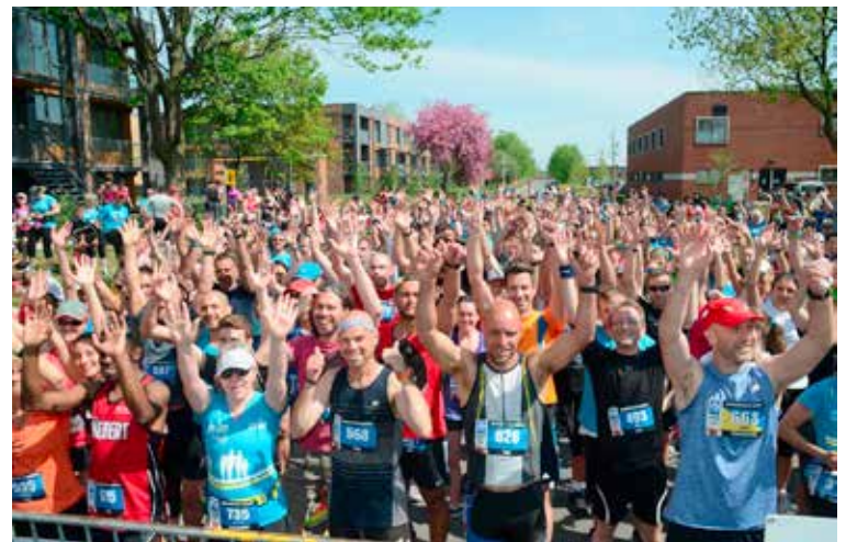
Près de 3 000 participants ont pris part à la première édition du Marathon SSQ de Longueuil. Il est déjà possible de s'inscrire pour 2017.

Renseignements et résultats à marathon-longueuil.com