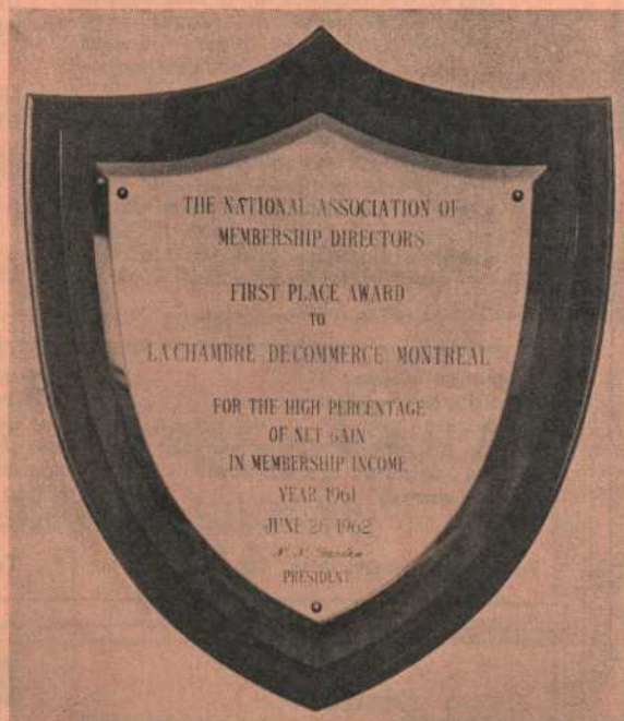
Plaque gagnée par votre Chambre au congrès annuel de la NAMD, en juin dernier.

Avec votre aimable concours, nous pouvons espérer de remporter encore le premier prix pour l'année 1962-63. Vous voulez nous y aider ?