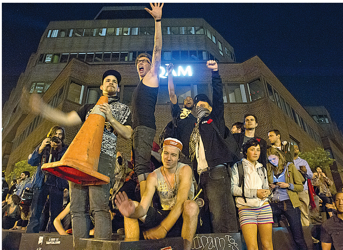
Les jeunes s'engagent à nouveau, constate Bernard Landry. Espérons que cela laisse présager qu'ils iront à l'avenir aux urnes autant que leurs aînés.

L'éducation jusqu'à la limite des talents et la volonté d'étudier de chacun constitue un droit individuel fondamental. Elle est liée aux chances de bonheur des humains de partout, particulièrement dans la complexité des défis contemporains.