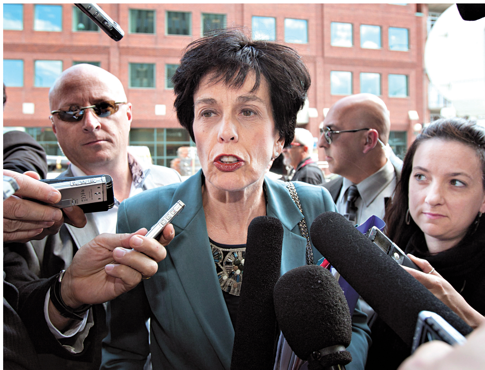
La ministre de l'Éducation, Michelle Courchesne, à son arrivée à l'édifice de la Banque Nationale, où se déroulent les négociations avec les étudiants.