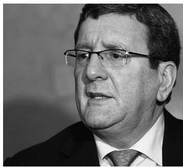
YAN DOUBLET LE DEVOIR Régis Labeaume

« Il faut mettre fin aux vaches sacrées et aux tabous dans le secteur municipal », a-t-il lancé hier dans un long discours devant la Chambre de commerce. « La faiblesse actuelle du pouvoir de négociation des villes se traduit par des concessions salariales significatives », dit-il. La tactique syndicale est bien connue : on fait des gains auprès de l'employeur le plus vulnérable, puis on essaie d'inclure ces gains dans les autres conventions collectives. »