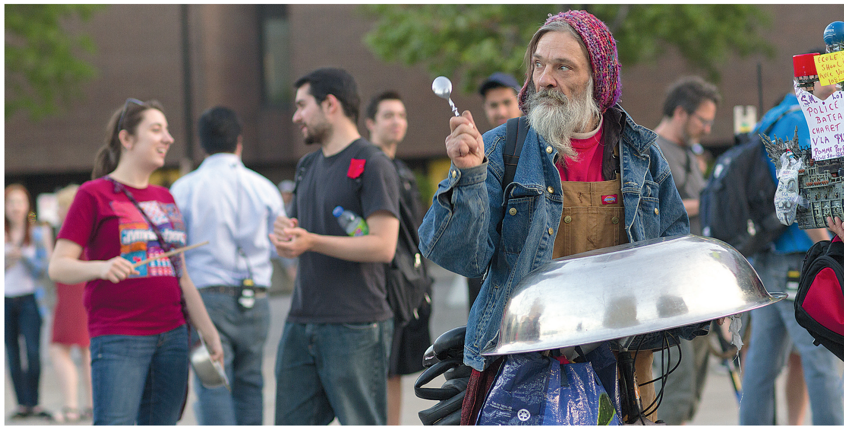
À 20h piles, les casseroles ont encore résonné hier à Montréal, mais aussi dans plusieurs autres villes du Québec, du Canada et même des États-Unis. PEDRO RUIZ LE DEVOIR