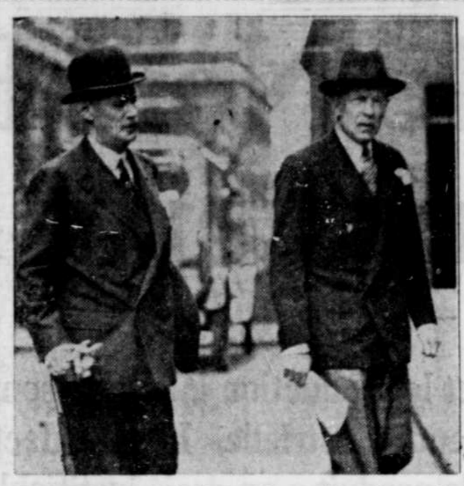
Sir Edmond Ovev, à gauche, l'ambassadeur anglais à Moscou, de retour à Londres où il est venu conférer avec le premier ministre MacDonald au sujet des six Anglais accusés de sabotage et d'espionnage par les Russes. A sa droite se trouve sir Robert Vanittart, sous-secrétaire d'état britannique pour les affaires étrangères.