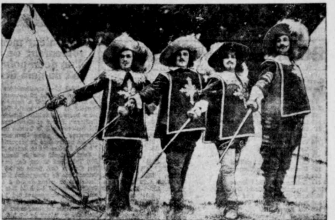
Le célèbre roman d'Alexandre Dumas interprété à l'écran sonore par des artistes de première valeur. — Un film qui tout Trois-Rivières attendait.