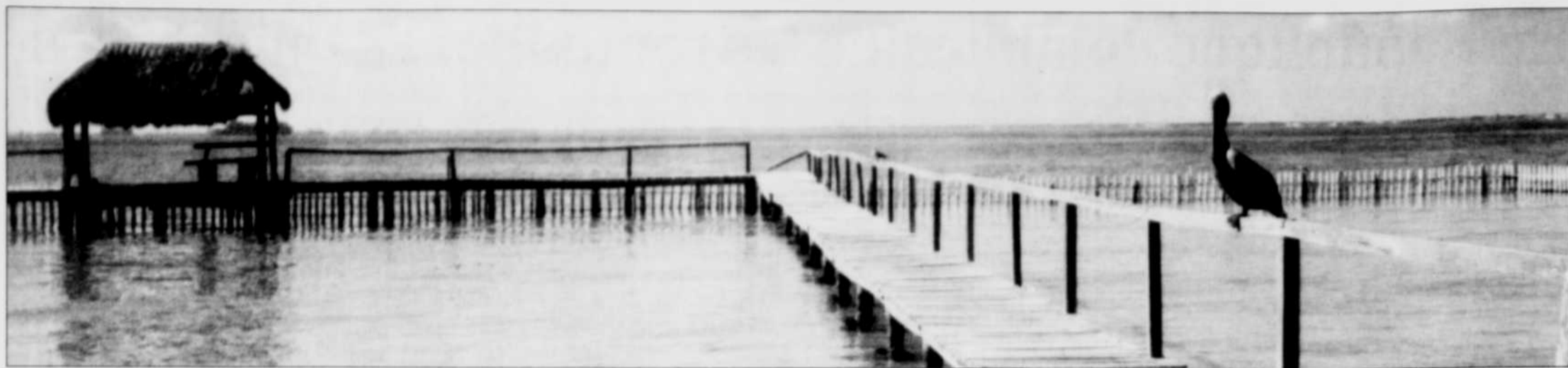
Un pélican affamé lorgne du côté des bébés tortues au Centre d'études marines, où une équipe tente de protéger les dernières tortues de mer.