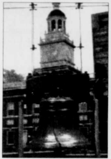
La cloche de la liberté et l'Independence Hall, là où sont nés les États-Unis d'Amérique.

Il y a une dizaine d'années, afin d'endiguer la prolifération des graffitis, les autorités locales décidèrent de céder quelques murs aveugles ou laids aux tagueurs. Cela deviendra rapidement une forme d'art populaire authentique. On compte aujourd'hui environ 2500 fresques murales à Philadelphie. Certaines, en trompe-l'œil, sont remarquables.