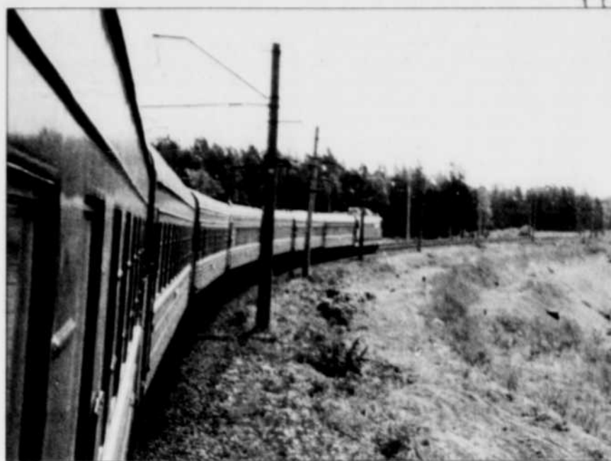
Le Transsibérien à mi-chemin entre Moscou et Vladivostok

À bord du train, c'est le va-et-vient continu. Les couloirs sont des lieux de rencontre et de convergence. On mange et on boit de la vodka (même si on semble aujourd'hui préférer la bière), on placote et on joue aux échecs. Des amitiés se nouent et parfois des idylles se créent. Après quelques jours de rail, on a non seulement l'impression d'être au bout du monde, mais également d'avoir oublié le reste du monde, si ce n'est du wagon-restaurant, qui devient le centre nerveux du train et qui permet d'oublier un peu la monotonie du trajet. Mais on est loin de l'époque où, au temps des tsars, l'on profitait des wagons-boudoirs, sortes de casinos roulants où l'on pouvait dépenser des fortunes, des wagons-tzi-