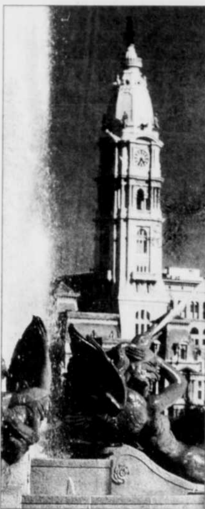
L'hôtel de ville est considéré comme un chef-d'œuvre architectural. L'architecte Calder a signé l'édifice centenaire et la fontaine des « Cygnes ».

cher sur ses propres Champs-Élysées. La célèbre artère de Paris a servi de modèle quand on a percé, au début du dernier siècle, la superbe avenue Benjamin-Franklin.