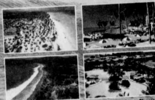
Photos: Bahía Principe, Plaza Pelicanos, Playa Tambor, Arenas Blancas.