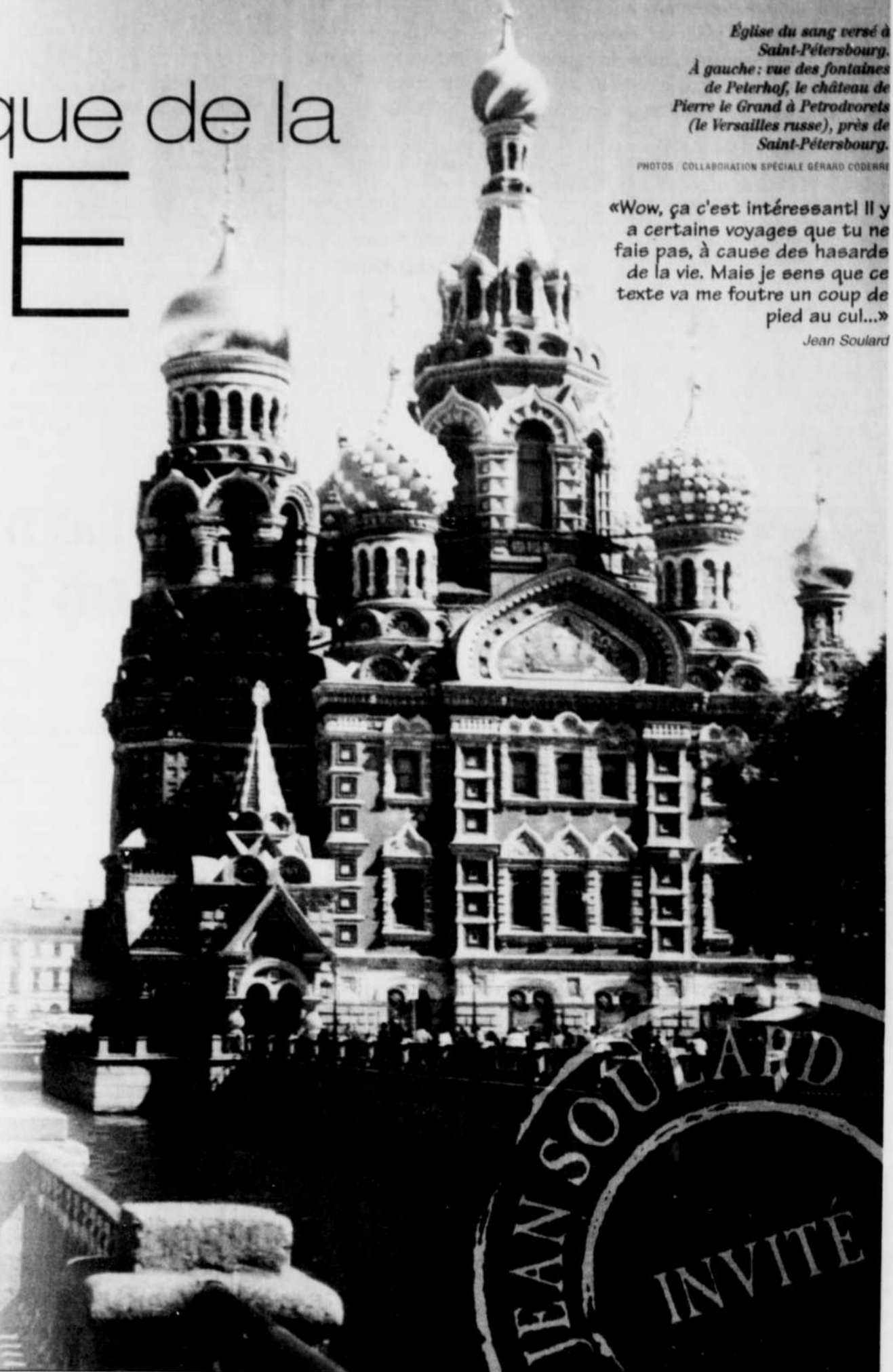
Église du sang versé à Saint-Petersbourg. À gauche : rue des fontaines de Peterhof, le château de Pierre le Grand à Petrodvorets (le Versailles russe), près de Saint-Petersbourg.

podium des grandes villes européen- nes. À lire en pages F 2 et F 3