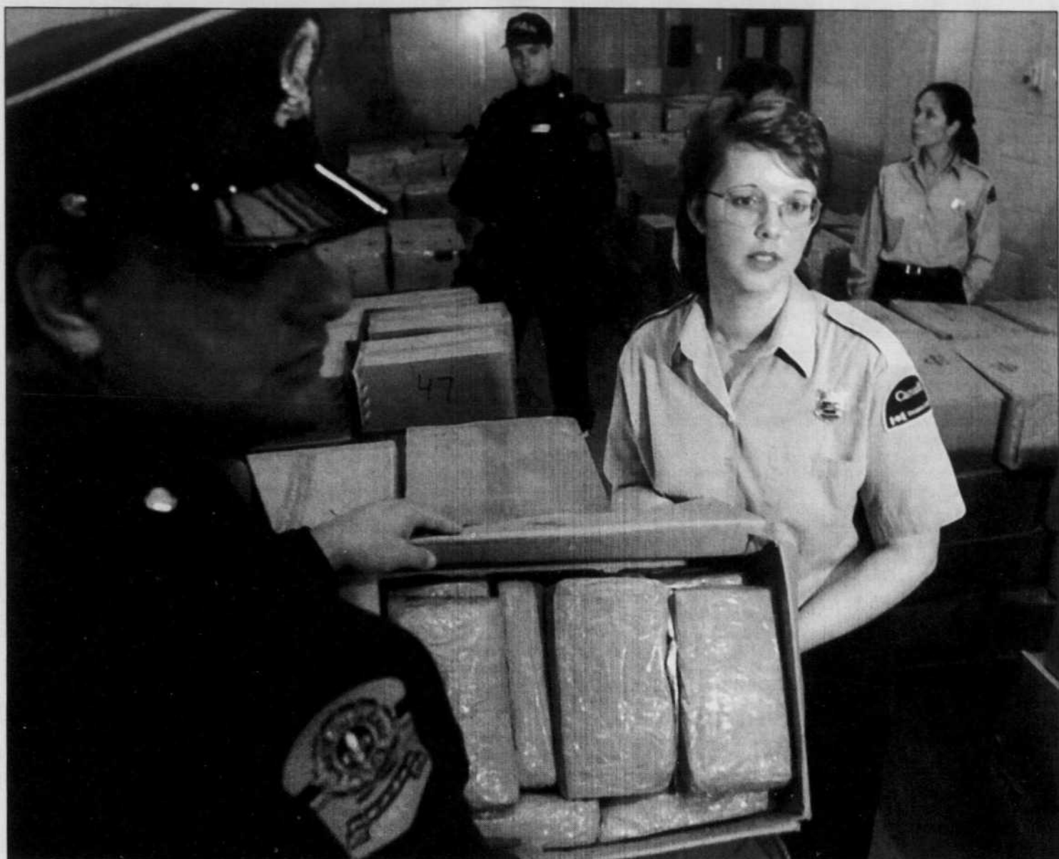
Policiers et douaniers exhibent les résultats d'une importante saisie. En 2000, au Canada, 6444 saisies de drogues d'une valeur de 892 millions ont été effectuées. Pour la marijuana seulement, on compte près de 1,2 tonne.