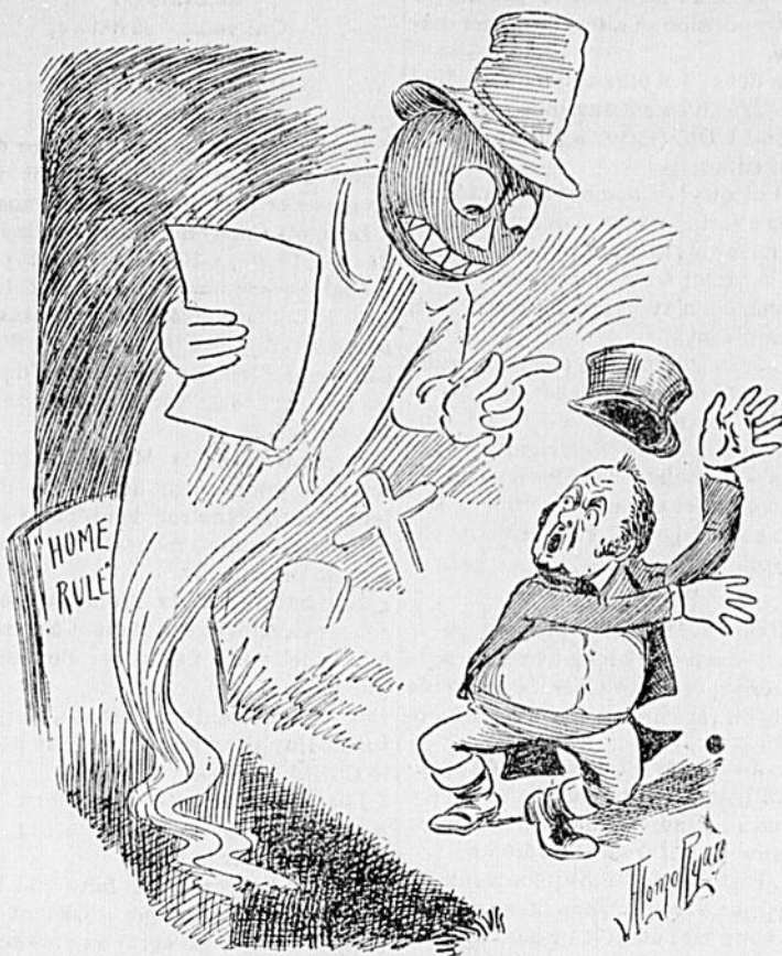
JOHN BULL.—Va t'en, méchant revenant.