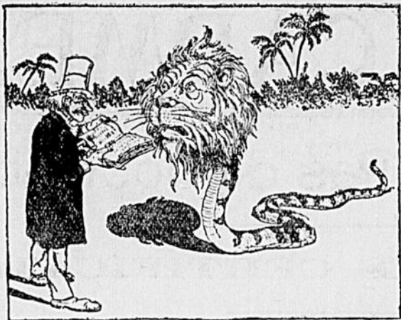
—Voilà un spécimen rare que mon catalogue m'indique pas.