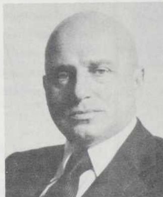
M. Louis Jalabert Président Banque Nationale de Paris

Le prix d'un billet 13$ • Le prix d'un carnet 110$ Réservation de tables: minimum de 5 personnes — jusqu'au lundi midi. Nous vous prions de respecter votre garantie lorsque vous réservez une table.