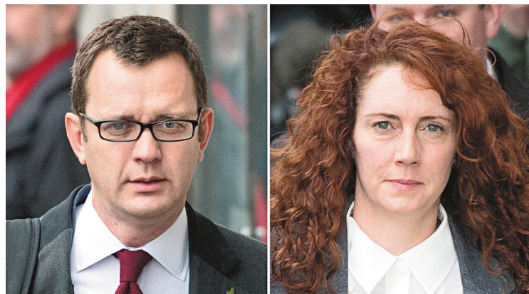
Cette combinaison de photos prises le 31 octobre 2013 montre l'ancien conseiller du premier ministre britannique David Cameron, Andy Coulson, déclaré coupable, et l'ex-reine des tabloïds, Rebekah Brooks, blanchie des accusations en lien avec les écoutes téléphoniques du News of the World .

Cameron à un mea culpa télévisé. «Je suis sincèrement désolé de l'avoir engagé. C'était une mauvaise décision, je le confesse très clairement», a déclaré le chef du gouvernement, l'air grave.