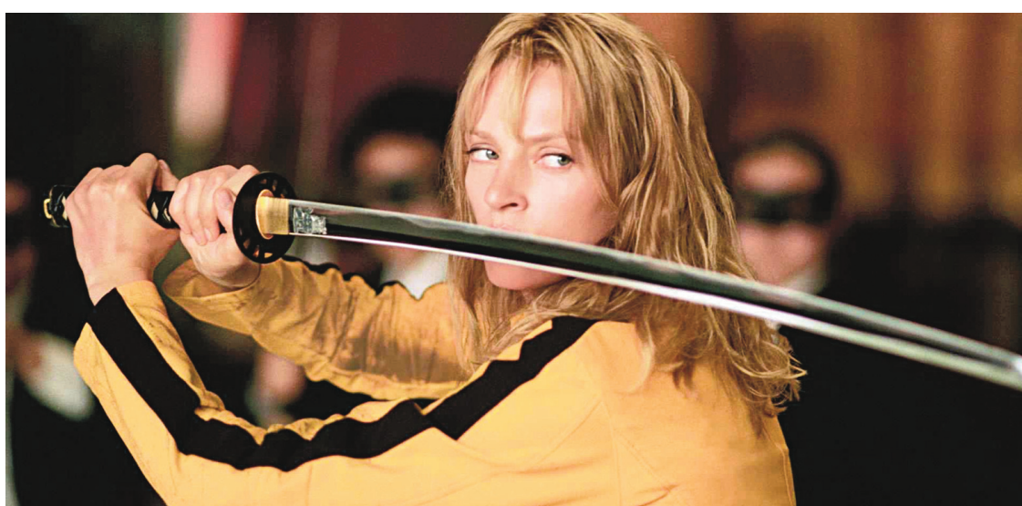
MIRAMAX FILMS 2003

Au-delà de son apport indéniable aux œuvres de Tarantino, ce repiquage musical devient une manière de signaler les influences artistiques, dans le second cas, voire les