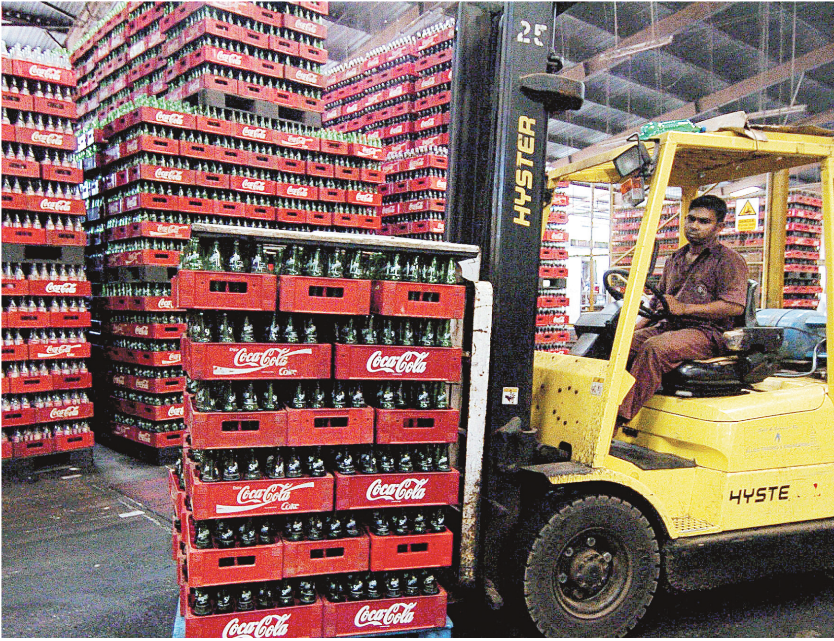
Les entreprises américaines risquent de perdre des dizaines de milliards de dollars en raison des perturbations climatiques annoncées. Coca-Cola, par exemple, dépend d'un approvisionnement stable en eau potable et en canne à sucre, deux intrants menacés par le réchauffement du climat.

ÉVEIL DES CONSCIENCES CHEZ LES PUISSANTS DE CE MONDE