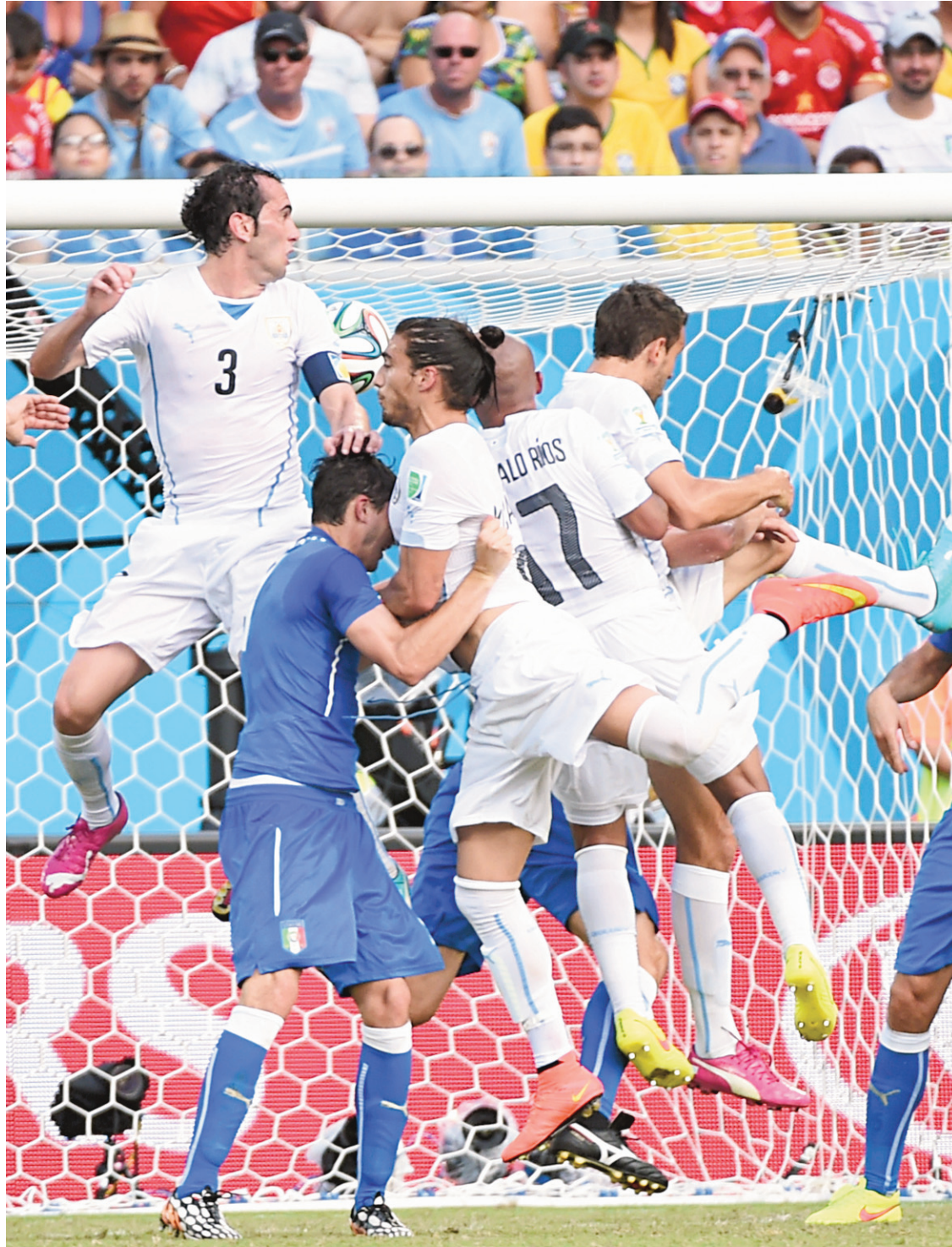
Le défenseur uruguayen Diego Godin (3) a redirigé un corner pour le seul but du match qualifiant son équipe pour les huitièmes de finale et éliminant l'Italie.