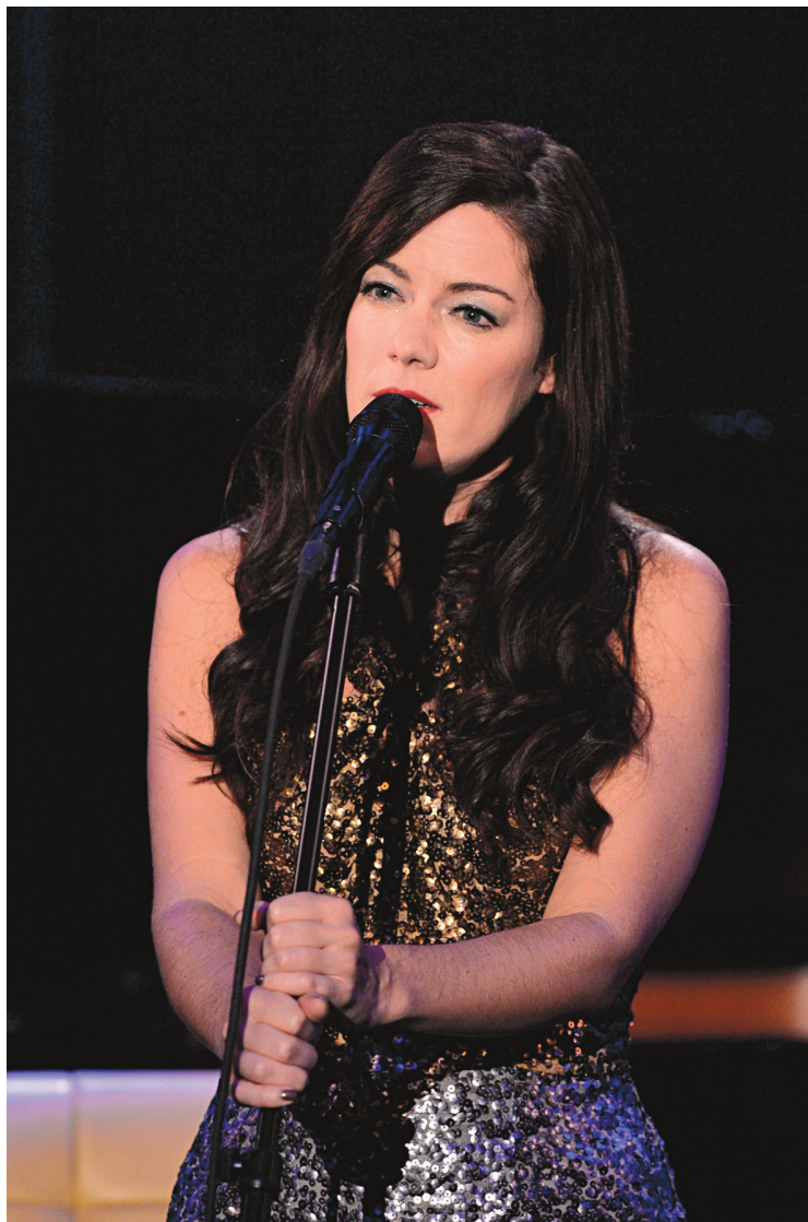
SIX MEDIA MARKETING

Au Festival international de jazz de Montréal, on peut évaluer la progression de sa popularité par celle des salles qu'on lui confie: Club Soda, Maison-neuve, et maintenant la grande scène de la place des Festivals (30 juin). «Ça va être un beau défi, dit-elle en entretien, parce que mes spectacles sont généralement très intimes. J'amène donc avec moi un gros groupe — huit musiciens au total: guitare, basse, batterie, piano,