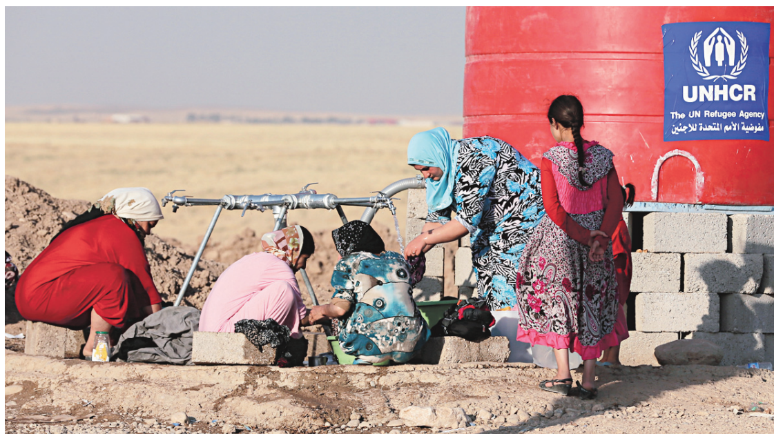
Des Irakiennes qui ont fui Tal Afar se ravitaillaient mardi dans un camp de réfugiés à Shikhan.

Dans la province d'al-Anbar, où les insurgés contrôlent plusieurs villes, l'armée appuyée par des tribus locales a repoussé un assaut sur la cité de Haditha, qui abrite une importante centrale électrique.