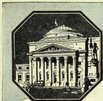
Siège social: Montréal

De l'étude légale: Rés. 70, St-Germain Bienvenue, Lacroix & Lebel Tél. 9953