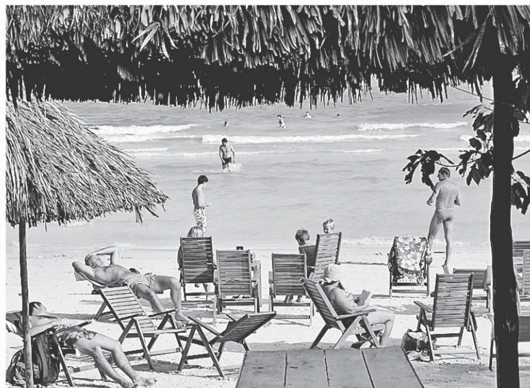
Les plages de Phu Quoc sont une invitation à la détente. Il faut y aller avant qu'elles ne deviennent une destination touristique aussi populaire que celles de la Thaïlande.

Et que dire de la plage Long Beach de Phu Quoc, sinon qu'elle est faite de sable blanc et qu'elle est magnifique. Si vous recherchez la solitude, vous trouverez ce qu'il faut dans de petits complexes hôteliers situés à une dizaine de kilomètres au nord de Duong Dong, à Bai Ong Lang ou encore plus au nord. C'est bien, mais nous avons préféré visiter ces endroits en scooter au lieu d'y passer la semaine. La plage de Bai Sao au sud de l'île est intéressante, mais elle est isolée et la propreté laisse à désirer. Long Beach demeure donc le meilleur choix.