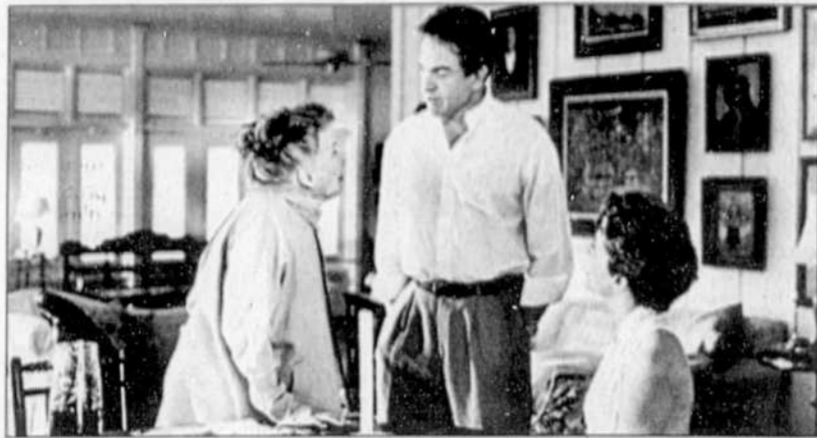
Katharine Hepburn, Warren Beatty et Annette Bening dans Love Affair .

Le pas de deux est dansé par Warren Beatty, l'éternel séducteur aux mille conquêtes, aux côtés cette fois d'Annette Bening. Ils se rencontrent dans un avion à la faveur d'une panne de moteur, auront une aventure,