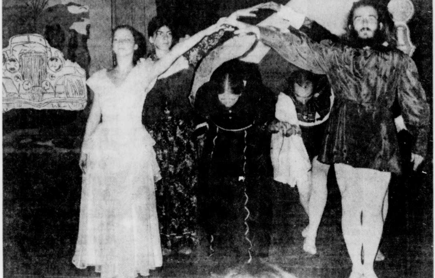
A Valcourt dans le cadre des terrains de jeux, la Troupe Enfantz a présenté un spectacle de ballet et de danse moderne devant une assistance de plus de cent personnes. Les principaux thèmes au programme étaient: Pierrot la lune, Robin des bois, Cendrillon et plusieurs danses auxquelles les jeunes ont eu beaucoup de plaisir à participer. Les décors et le système de son étaient particulièrement soignés.

Le stationnement sur le boulevard Notre-Dame deviendra d'une durée de 30 minutes. Auparavant il était d'une heure. L'échevin Surprenant, un ardent partisan des parcmètres, a souligné que l'on devrait s'occuper de voir la possibilité d'installer ces engins sur cette rue mais pour l'instant ceci a été remis par les autres échevins.