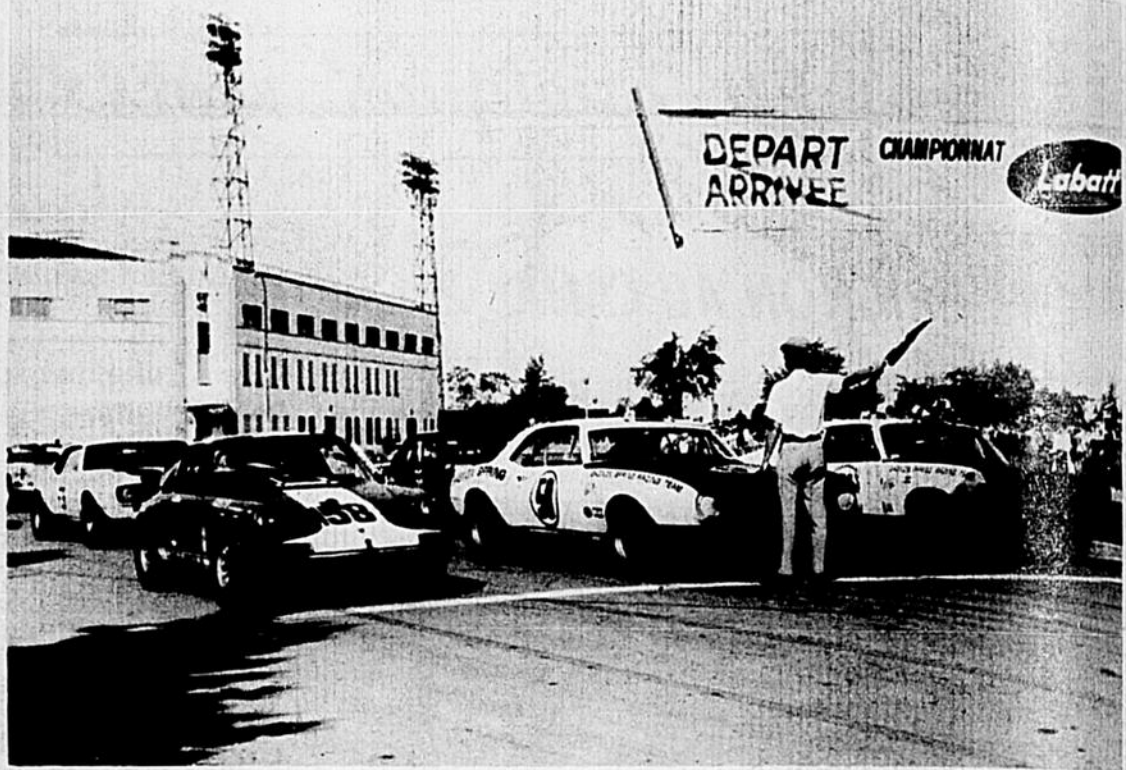
Un instant d'émotion marque le départ de la première course sur le circuit d'un mille et quart semé de virages et de descentes. Ce n'est pas sans raison qu'on évoque le Grand Prix de Monaco en voyant la piste de l'Expo. Les pilotes ont dû faire preuve