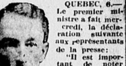
L'HON. M. TASCHEREAU. Dans Deux-Montagnes, nous avons réduit très considérablement la majorité de M. Sauvé. Elle est passée de 1007 à 1002 voix.

Dans Maskinongé. Hunterstown: L.-J. Thisdel A. Lamy 7. Louiseville: Poll 1 . . . . . 27 Poll 2 . . . . . 29 Poll 3 . . . . . 5 Masson . . . . . 1. Riv. du Loup: Poll 1 . . . . . 61 Poll 2 . . . . . 32 Saint-Alexis: Poll 1 . . . . . 36 Poll 2 . . . . . 24 Saint-Didace: Poll 1 . . . . . 2 Poll 2 . . . . . 2 Poll 3 . . . . . 2 Poll 4 . . . . . 2 Saint-Angèle: Poll 1 . . . . . 22 Saint-Edouard: Poll 1 . . . . . 11 Sainte-Ursule: Poll 1 . . . . . 15 Poll 2 . . . . . 15 Poll 3 . . . . . 26 Poll 4 . . . . . 13 Saint-Joseph: Poll 1 . . . . . 11 Saint-Justin: Poll 1 . . . . . 8 Poll 2 . . . . . 8 Poll 3 . . . . . 8 Saint-Léon le Grand: Poll 1 . . . . . 36 Poll 2 . . . . . 13 Saint-Paulin: Poll 1 . . . . . 13 Saint-Paulin Par.: Poll 1 . . . . . 13 Poll 2 . . . . . 30 Poll 3 . . . . . 11 Maskinongé: Poll 1 . . . . . 24 Poll 2 . . . . . 6 Poll 3 . . . . . 33 La majorité complète pour M. Thisdel est d'environ 400. Les chiffres cités plus haut ne sont pas complets.