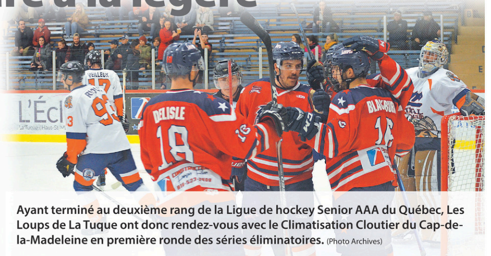
Ayant terminé au deuxième rang de la Ligue de hockey Senior AAA du Québec, Les Loups de La Tuque ont donc rendez-vous avec le Climatisation Cloutier du Cap-de-la-Madeleine en première ronde des séries éliminatoires.