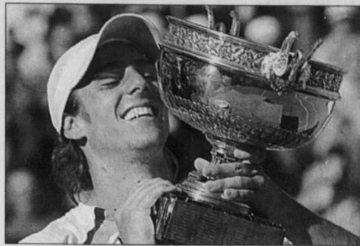
Gastón Gaudio a signé sa première victoire dans un tournoi du Grand Chelem.