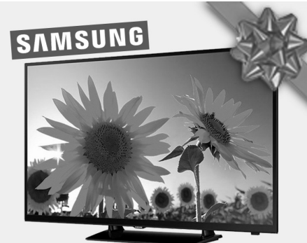
TÉLÉVISEUR 40" LED HD 1080p