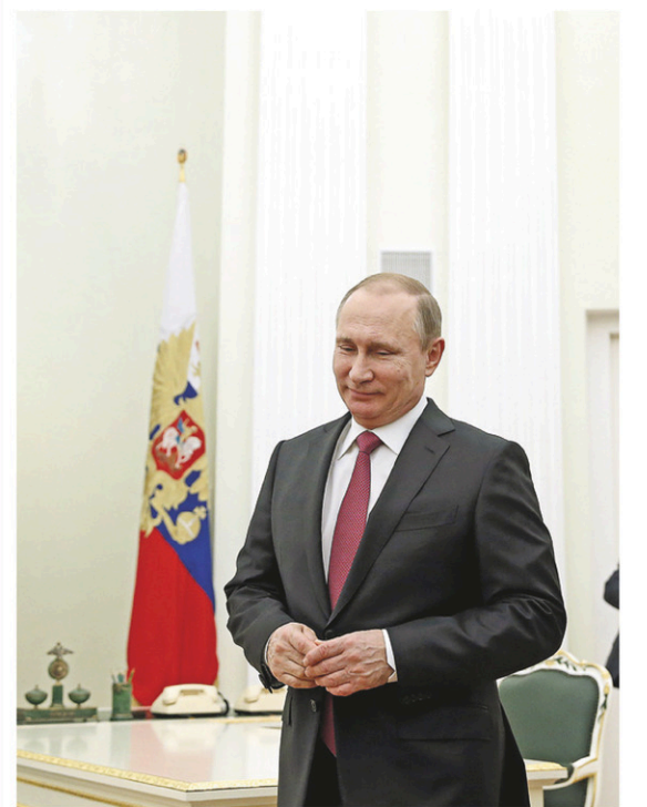
Vladimir Poutine