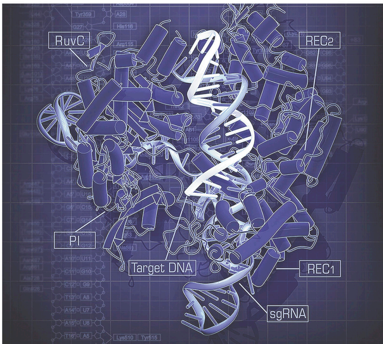
Une structure du Cas9 de S. pyogenes (une bactérie appartenant au genre Streptococcus ) dans un complexe avec notamment son ADN cible.

Actuellement, la technique CRISPR-Cas9 est surtout utilisée en recherche fondamentale. «Beaucoup de progrès ont été faits en génomique. On séquence des génomes à une vitesse incroyable, mais en fin de compte, il reste encore beaucoup