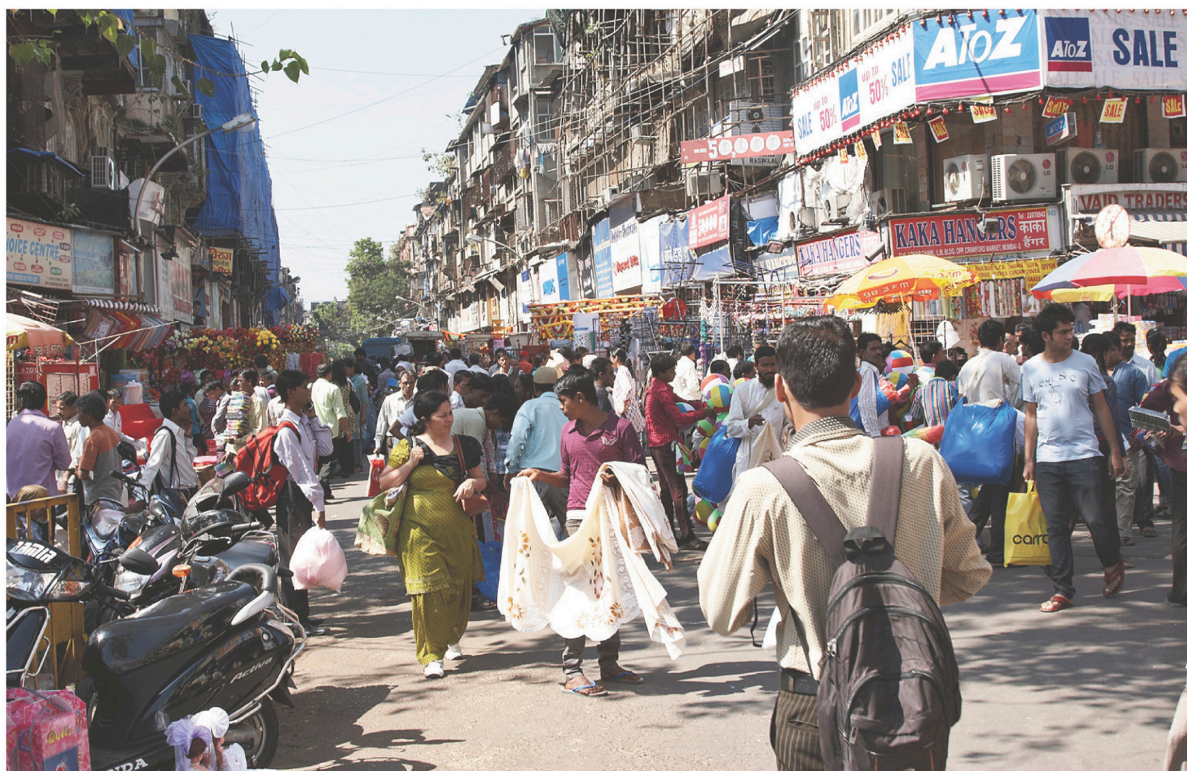
Le revenu national indien par habitant s'établit à 1570 dollars par an.