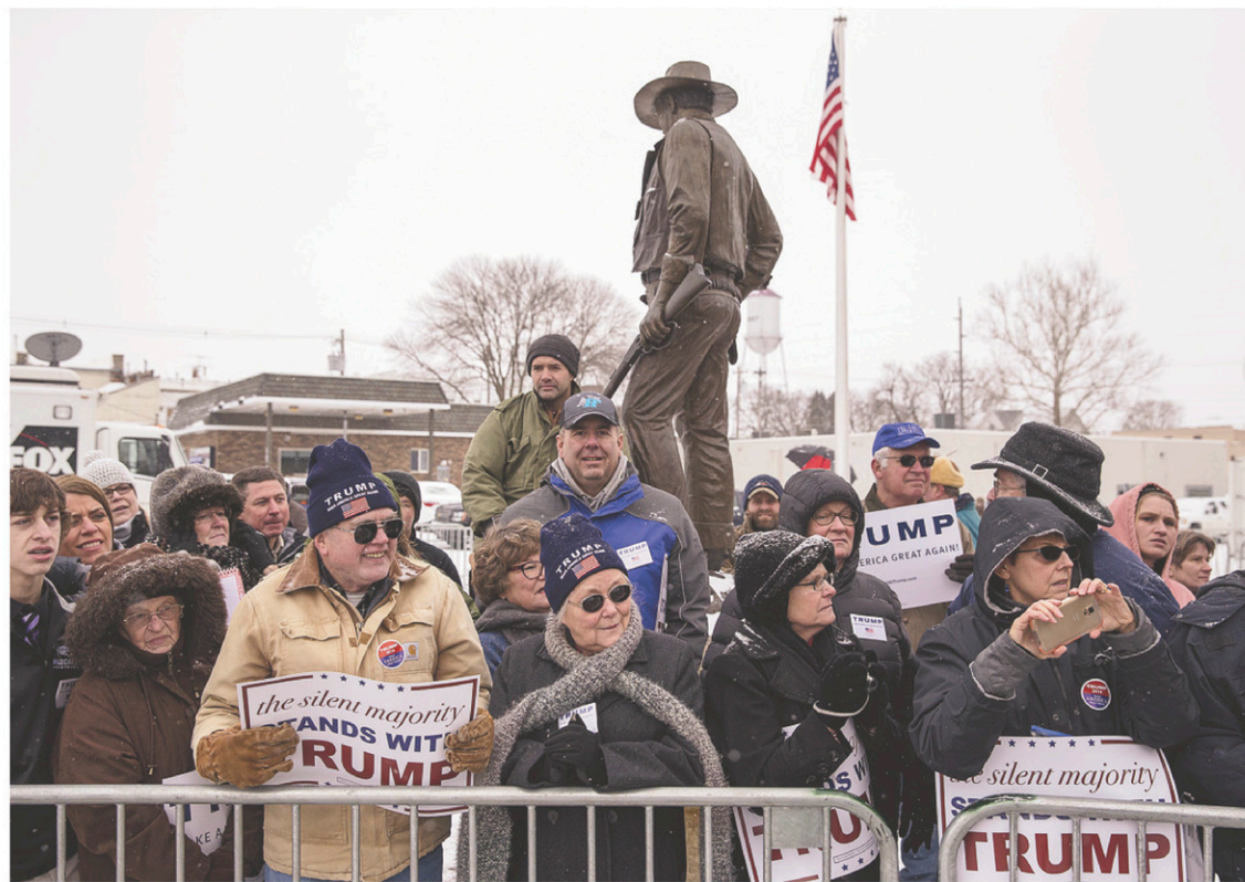
Des partisans de Trump cette semaine dans la ville natale de John Wayne, Winterset