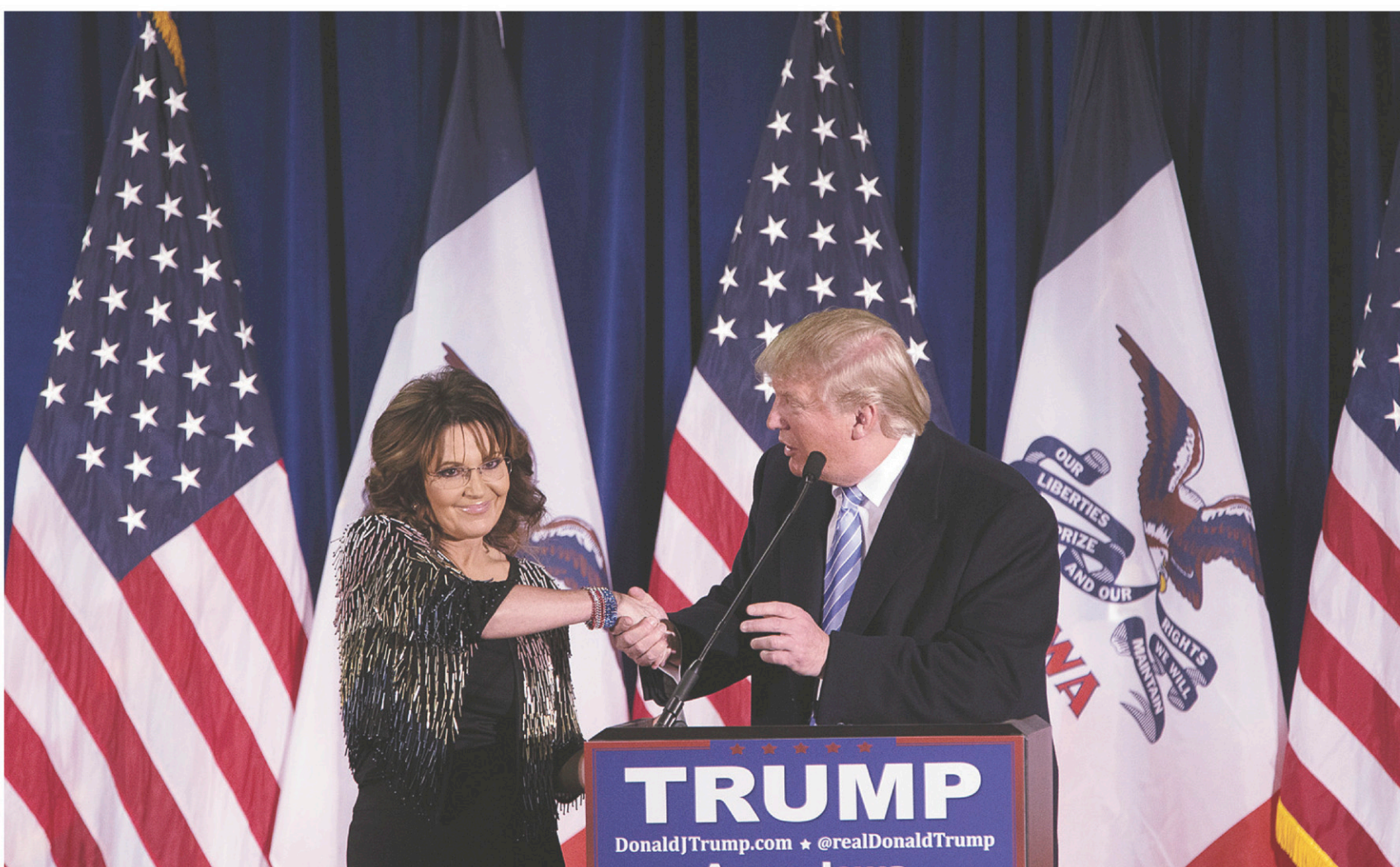
Le ralliement de l'égérie du Tea Party, Sarah Palin, pourrait renforcer Donald Trump en Iowa.