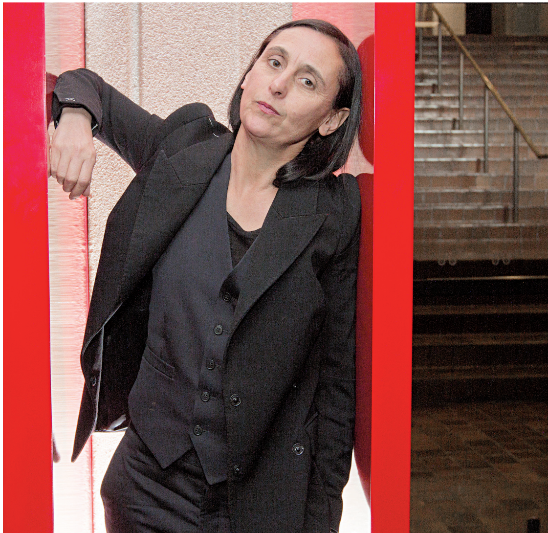
La Belge Anne Teresa De Keersmaeker a reçu mardi le Grand Prix de la danse de Montréal, muni d'une spectaculaire enveloppe de 50 000 $ qui a peu de pareilles sur la scène mondiale.

Les Prix de la danse de Montréal ont été instaurés l'an dernier par Marie Chouinard, qui a elle-même versé les 50 000 $ de la première récompense, accordée à Louise Lecavalier. La très généreuse enveloppe du Grand