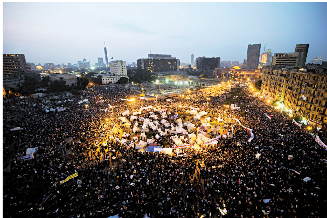
Des manifestations ont eu lieu mardi dans les principales villes d'Égypte, comme au Caire.

Ces accrochages ont été dénoncés par de nombreux manifestants anti-Morsi à Tahrir, dé-