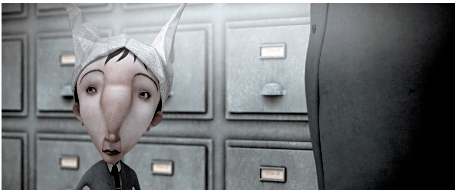
PAPY3D PRODUCTIONS ET ONF

Chez le cinéaste Franck Dion, le film émane d'un dessin. Celui d'un homme avec un bonnet d'âne en papier sur la tête s'est imposé.