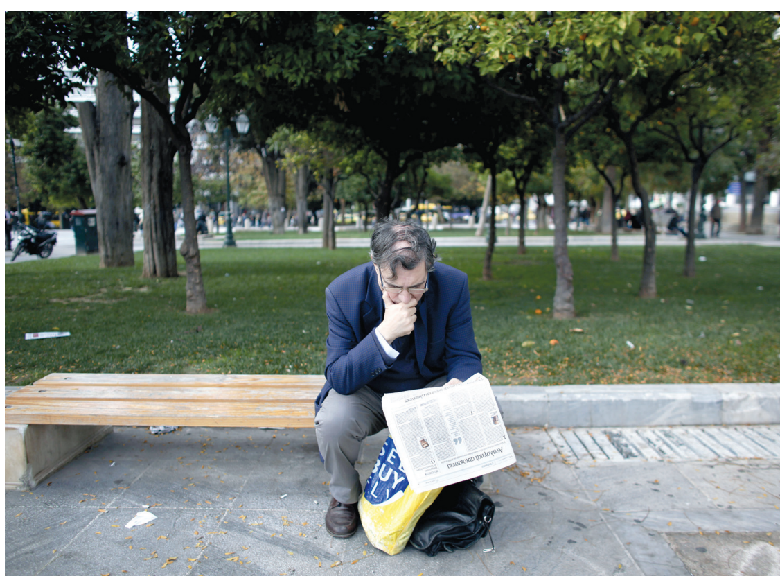
Assis sur un banc public dans un parc d'Athènes, un homme prend connaissance des détails de l'entente qui aidera son pays à sortir de la crise de la dette.