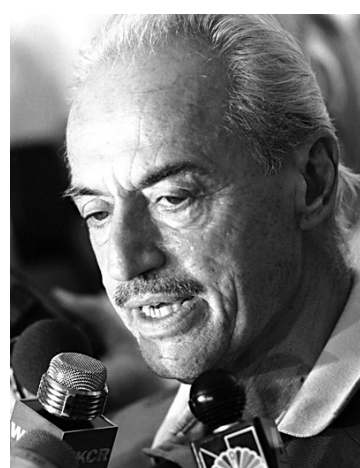
Marvin Miller pendant une grève des joueurs de baseball en 1981.

son père, à l'instar de sa mère, voulait que son corps soit confié aux chercheurs de l'hôpital Mount Sinai. Elle a indiqué que la famille n'avait pas encore décidé s'il y aurait des funérailles.