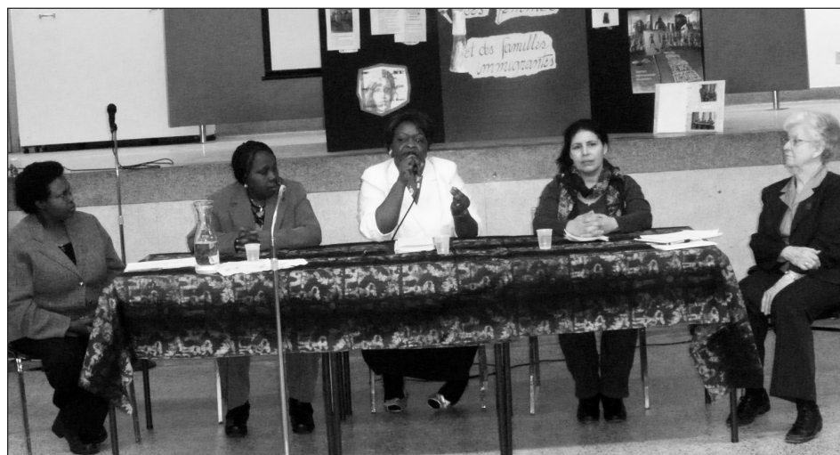
Montréal, 26 février 2011