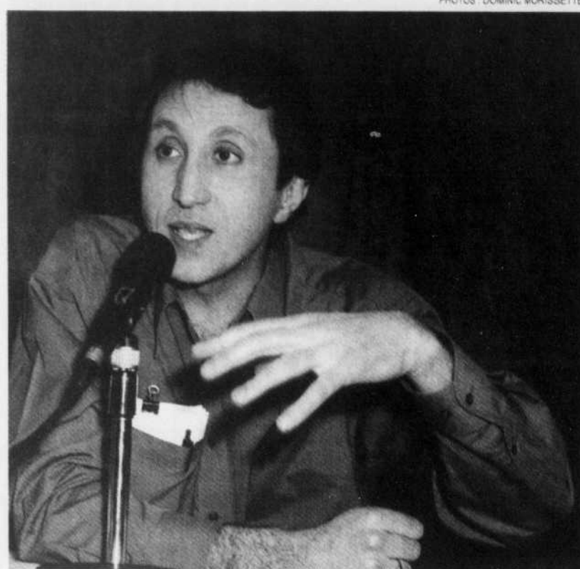
Amir Khadir, porte-parole de l'Union des forces progressistes