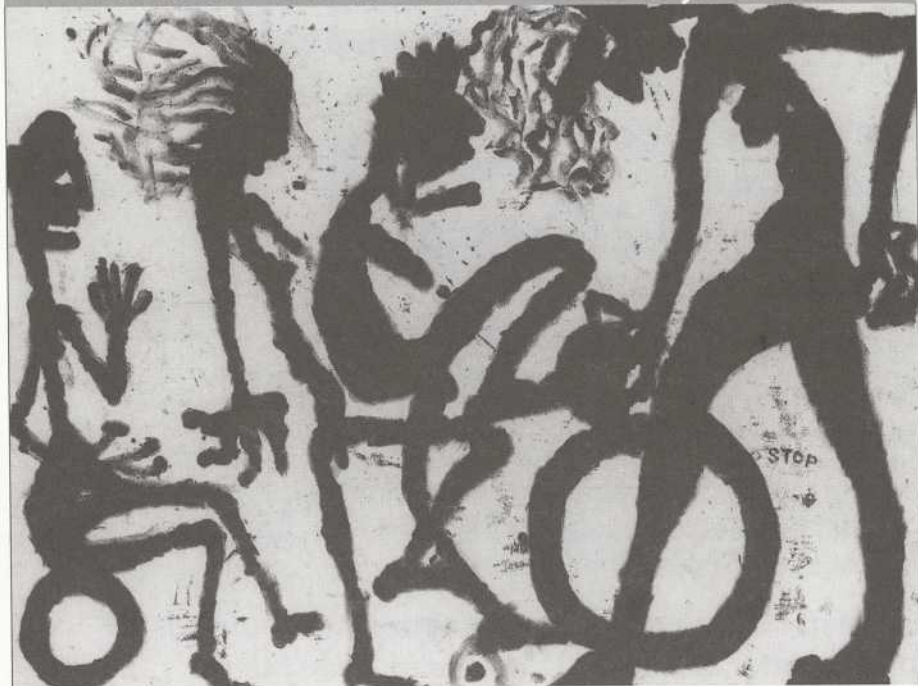
Louis Soutter, Stop, Collection Musée des Beaux-Arts, Lausanne, Suisse