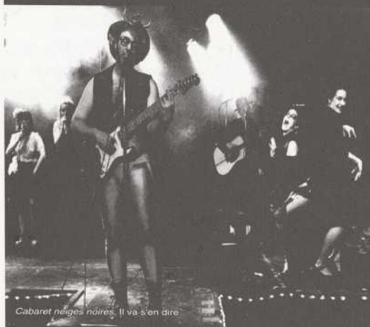
Cabaret nèges noires. Il va s'en dire

4012, rue Saint-Denis Coin Duluth tél.: 844-1919