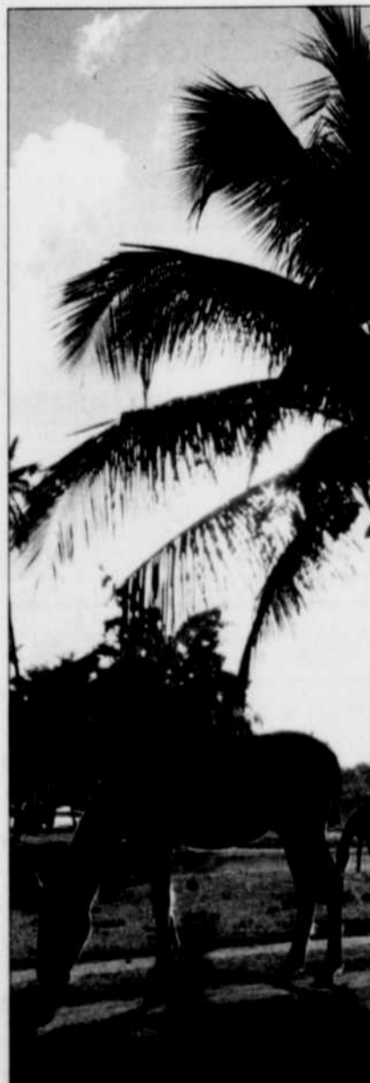
D'élégants chevaux sauvages de type Paso Fino errent dans l'île.