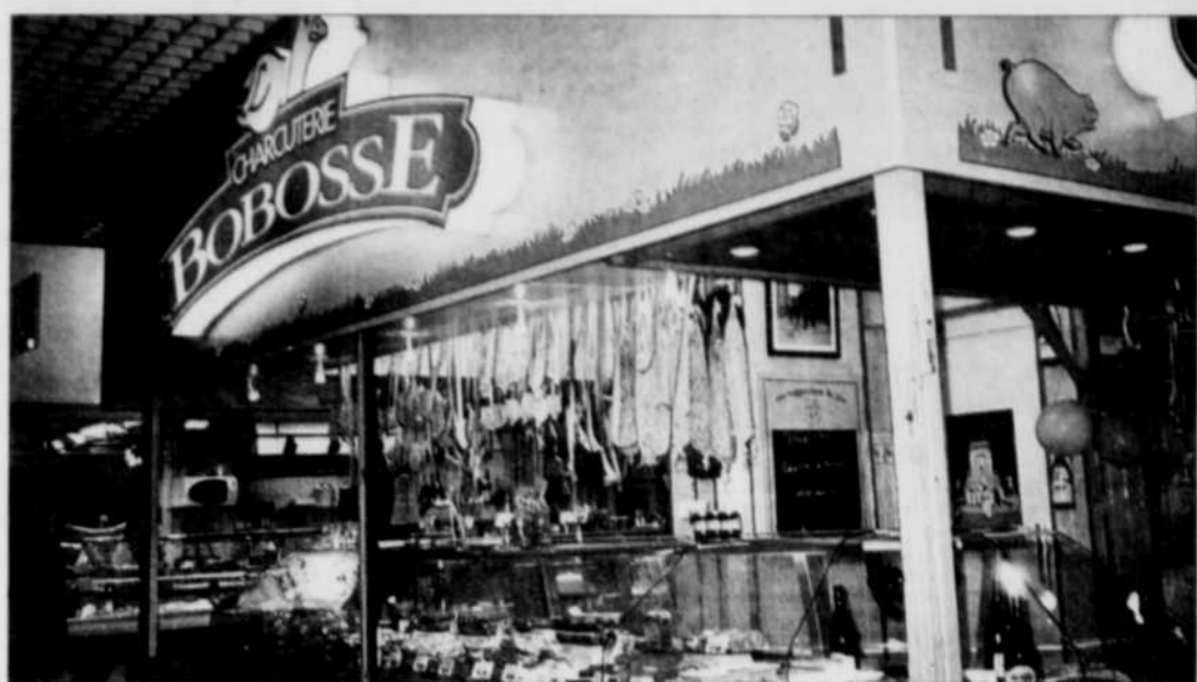
Haut lieu de la charcuterie, Lyon est aussi la capitale de la gastronomie en France.

En partant ainsi à la recherche de la gastronomie locale, quels que soient vos goûts et votre budget, vous pourrez agréablement parcourir les différents quartiers de Lyon et sa région, qui méritent bien le détour.