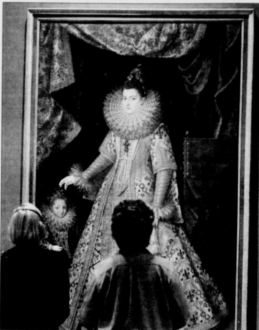
Jusqu'au 1 er mai, seront exposés au Norton Museum de West Palm Beach 130 objets d'art dont cette peinture du Flamand, Frans Pourbus le jeune, représentant Isabel Clara Eugenia, fille de Philippe II et gouverneure des Pays-Bas.

aux enchères de Sotheby en 1969. L'acheteur, l'acteur britannique Richard Burton, en avait fait ensuite cadeau à Elizabeth Taylor, qui en est toujours propriétaire.