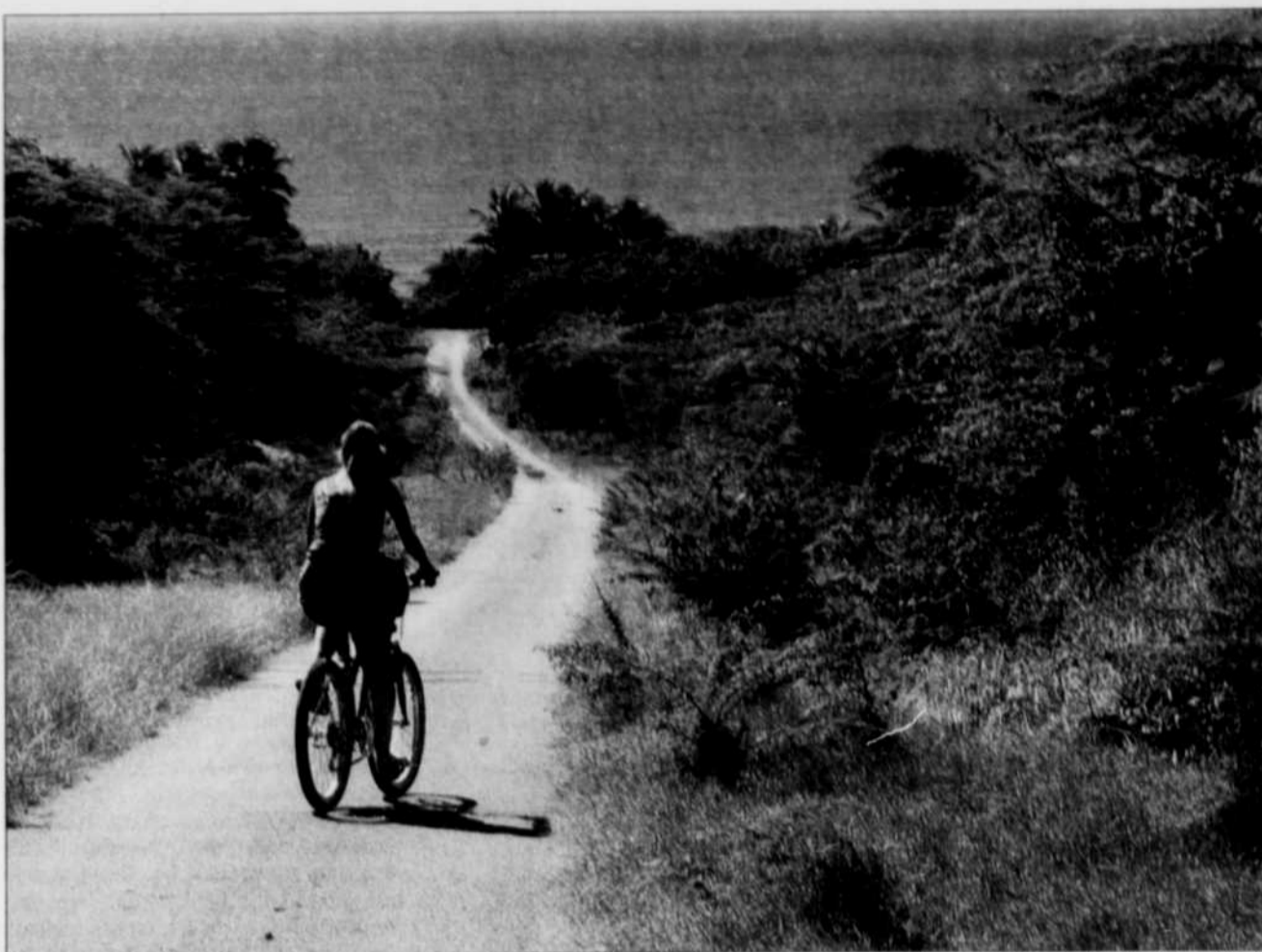
Vieques n'est pas encore desservie par les compagnies aériennes, ce qui protège son allure sauvage.

La nuit tombée, il est fortement conseillé d'aller se baigner au moins une fois à Bahía Mosquito, la baie bioluminescente. À chaque mouvement, la mer s'illumine et votre corps brille de mille particules phosphorescentes. Car les eaux de la baie abritent une concentration très élevée de Pyrodinium bahamense, des organismes microscopiques qui émettent de la lumière au moindre contact. Des excursions sont proposées en kayak ou à bord d'un bateau à moteur électrique. Ces micro-orga-