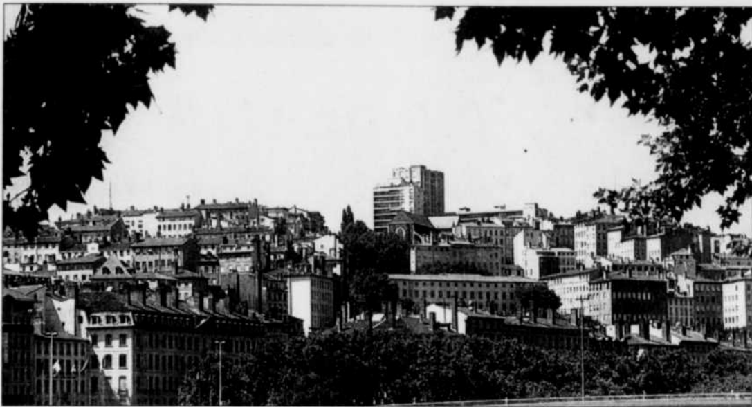
Lyon est aussi classée au patrimoine mondial de l'UNESCO.