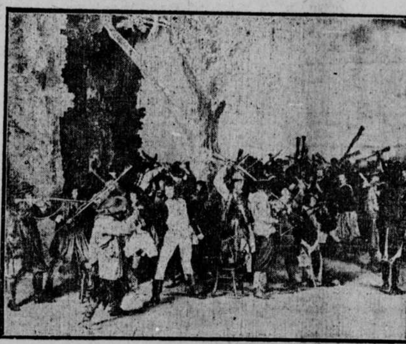
Une scène des "Chouans" au "Français"