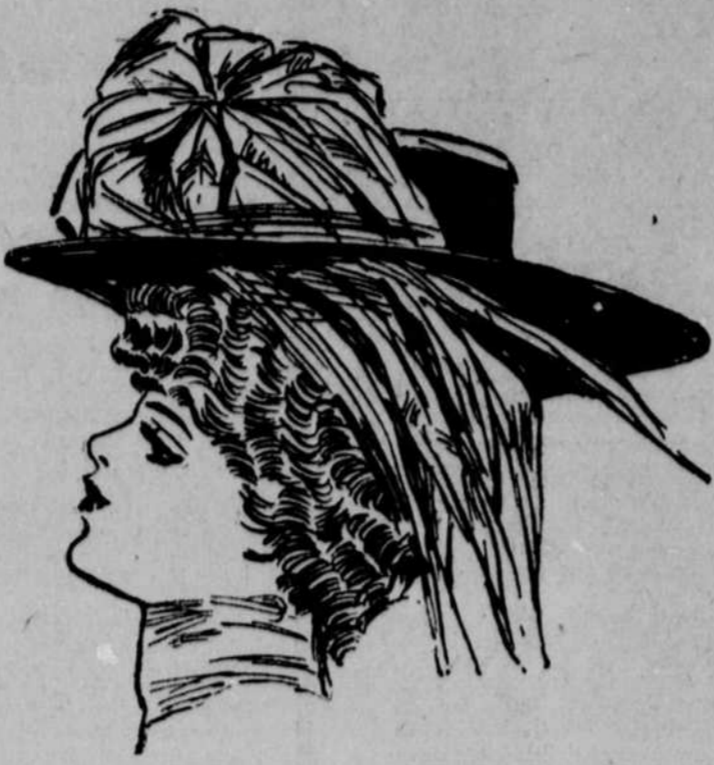
Très gentil et très commode pour voyager ce petit chapeau sailor, de paille brune, qu'agrémentent un chou de taffetas rose et un bouquet de plumes blanches...