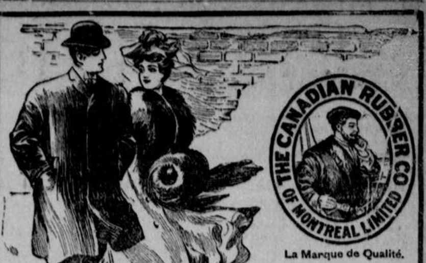
LA MARQUE DE QUALITÉ.

Nouveaux applaudissements, nouvelles ovations. — On devait terminer par un handicap, à cet effet renvoyé à une autre séance. Aujourd'hui, on va fêter les vainqueurs en d'innombrables chopes de bière.