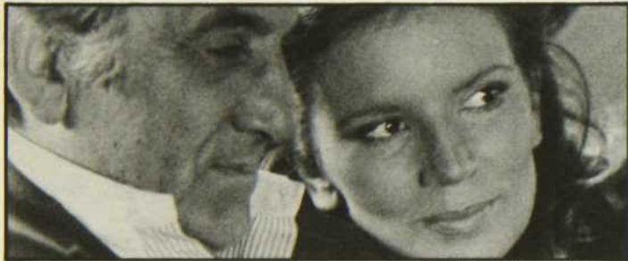
«Un papillon sur l'épaule»