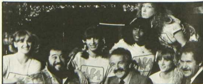
«Je te tiens, tu me tiens par la barbichette»

La critique française a souligné la qualité du film et la profondeur de la réflexion qu'il suscite sur la mort et la création artistique. Comme l'écrivait un journaliste parisien: «Des images admirablement composées illustrent une pensée mouvante et continuellement en recherche. Riche en inventions stylistiques, cette oeuvre s'ajoute avec honneur au palmarès du réalisateur.»