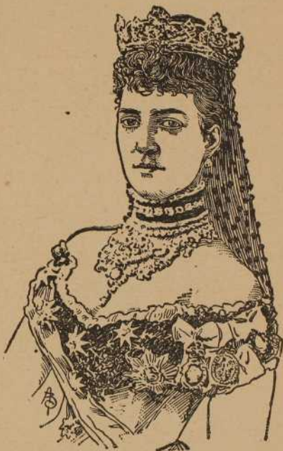
LA REINE ALEXANDRA.

IV.—Le quatrième est le prince Alfred-Alexandre-Guil-