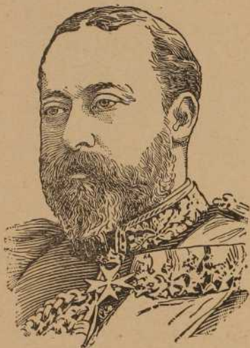
LE ROI EDOUARD VII.

Jusqu'à la mort du prince Albert, qui est survenue le 11 décembre 1861, la reine a été parfaitement heureuse : plusieurs attentats contre sa personne, dont le dernier a eu lieu en 1862, ne l'ont nullement affectée. Mais après la mort du prince consort, elle resta cinq ans très retirée, et ne se montra pas en public jusqu'à l'année 1866.