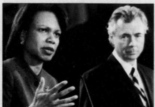
CHRIS WATTIE REUTERS