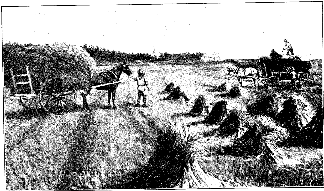
La moisson. Scène canadienne. D'après un tableau de A. Masselotte.