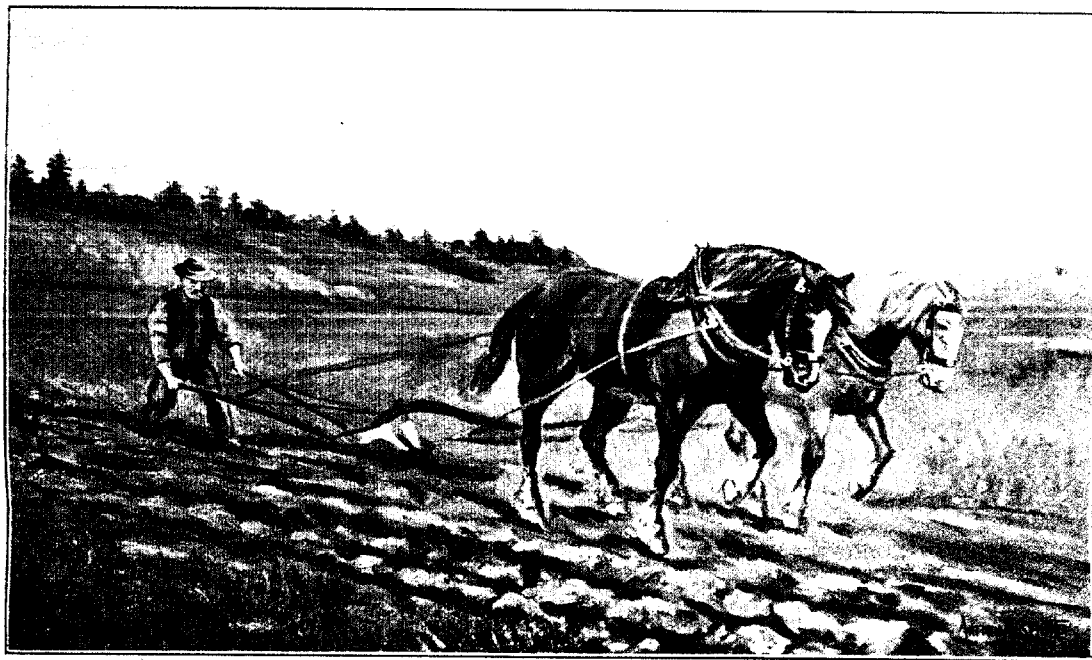
Labour en terre neuve. Scène canadienne. D'après un tableau de A. Masselotte.