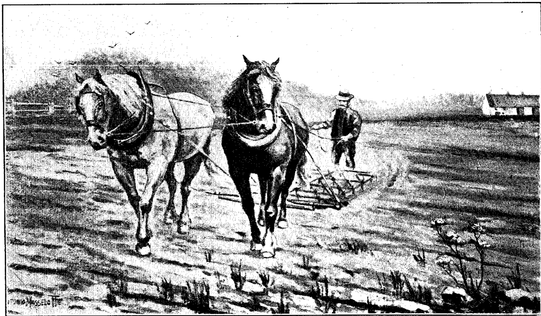
Le hersage. Scène canadienne. D'après un tableau de A. Masselotte.