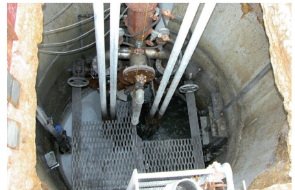
Puits mouillé d'une station de pompage d'eaux usées