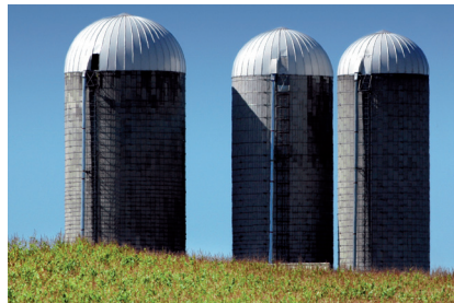
Silos / à grains, hermétiques / à fourrage