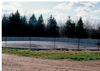
Fosse à lisier