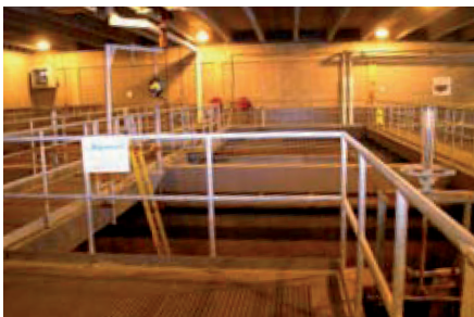
Cuve / Bassin