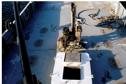
Cale de bateau