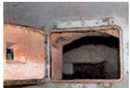
Four / Chaudière / Incinérateur

Plusieurs synonymes peuvent correspondre aux noms des espaces clos proposés.