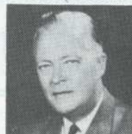
M. JEAN LESAGE chef de l'Opposition Gouvernement du Québec