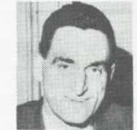
M. CLAUDE RYAN directeur - Le Devoir