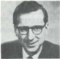
M. ROBERT BOURASSA économiste député de Mercier