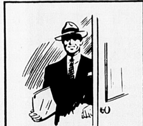
Le vendeur du Troisième Emprunt de la Victoire représente le Pays. Accueillez-le comme un ami. Pour épargner son temps, à une époque où il est extrêmement occupé, fixez dès maintenant le montant que vous prêterez au Canada. Achetez des Obligations à la limite de vos moyens.

Un avertissement aux nazis. Cité du Vatican. — Dans une émission destinée spécialement à l'Allemagne, un commentateur de la radio du Vatican a déclaré ce qui suit: "Que personne ne se trompe sur le silence et la patience de Dieu. L'heure du jugement viendra. Ce sera une heure terrible pour tous les négateurs du Très Haut, pour tous ceux qui ont commis des crimes infâmes contre Lui. La vérité elle-même peut être étouffée, mais aucun pouvoir ne peut enlever l'âme. Car elle est notre possession pour l'éternité, et nous n'en