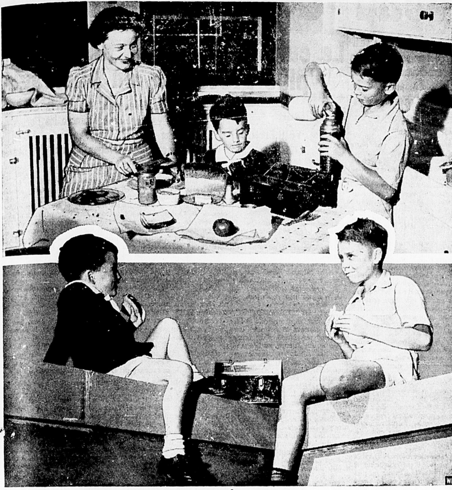
La boîte à lunch est une fourniture de classe qui le dispute en importance au cahier d'exercices, pas'autant la boîte à lunch, que ce qu'on y met. Les enfants qui vont en classe ont besoin d'une nourriture saine et variée: sandwiches de pain de blé entier, un oeuf ou de la viande, beurre d'arachides et miel, tomates et pommes, biscuits, lait en abondance.