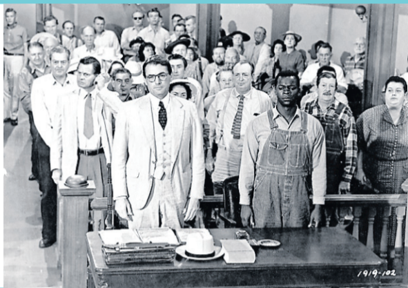
Le film To Kill a Mockingbird