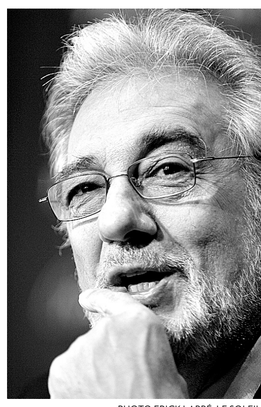
Le ténor Plácido Domingo, organisateur du concours Operalia, à Québec en septembre dernier.