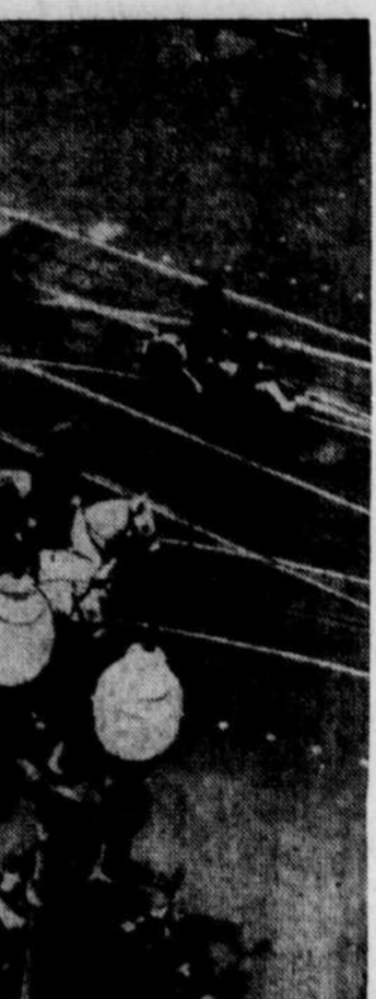
Violent raid sur Tokio

Des troupes du 1 er corps ont occupé une autre petite île, Cagarray, au large de la côte sud-est de Luzon, et ont consolidé ainsi les positions américaines à l'entrée de l'important port de Legaspi.