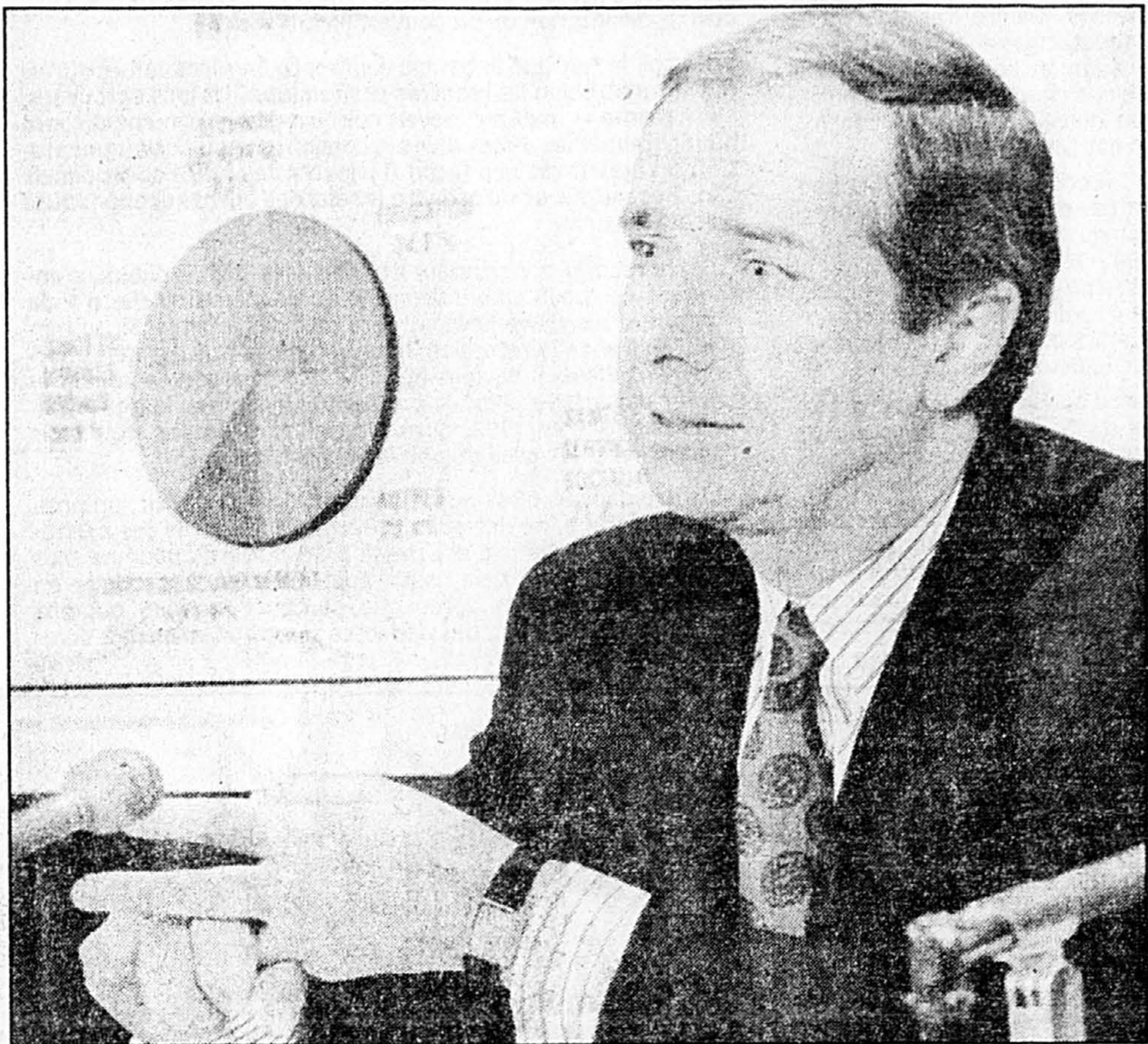
Le président du Conseil du trésor, Daniel Johnson, a dévoilé hier les prévisions de dépenses du gouvernement du Québec pour la prochaine année financière.

● Le gouvernement espère économiser 106 millions en réduisant surtout le personnel dans la fonction publique et chez les non-enseignants du réseau scolaire et en n'indexant pas les coûts de fonctionnement des ministères (2,3 pour cent).