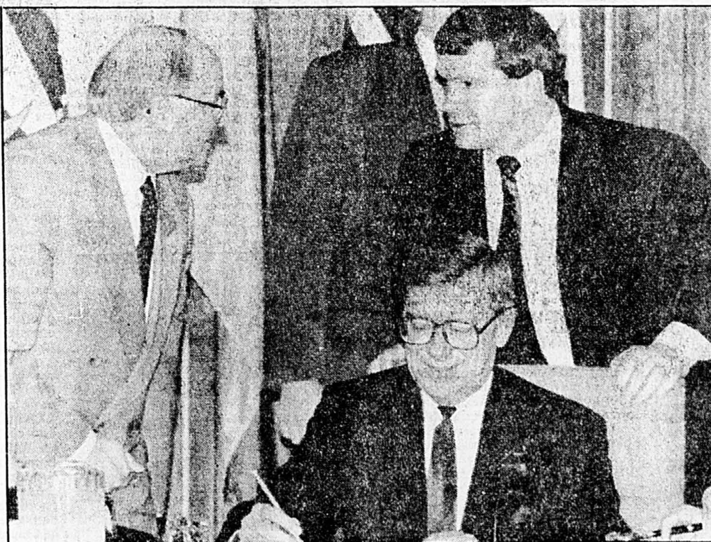
Le ministre des Finances, Gérard D. Levesque, représente le Québec à la conférence des premiers ministres sur l'économie, à Toronto. Sur la photo, il est entouré du ministre fédéral d'État aux Finances, Gilles Loiselle (à gauche), et du premier ministre du Nouveau-Brunswick, Frank McKenna.

Il a dû aussi répéter que la date d'entrée en vigueur d'un éventuel accord trilatéral restait aléatoire. Selon le docu-