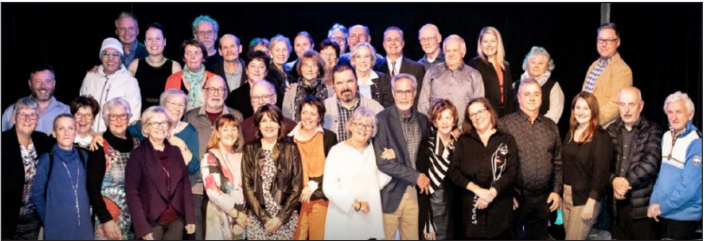
Bénévoles et partenaires d'Autour de l'Île