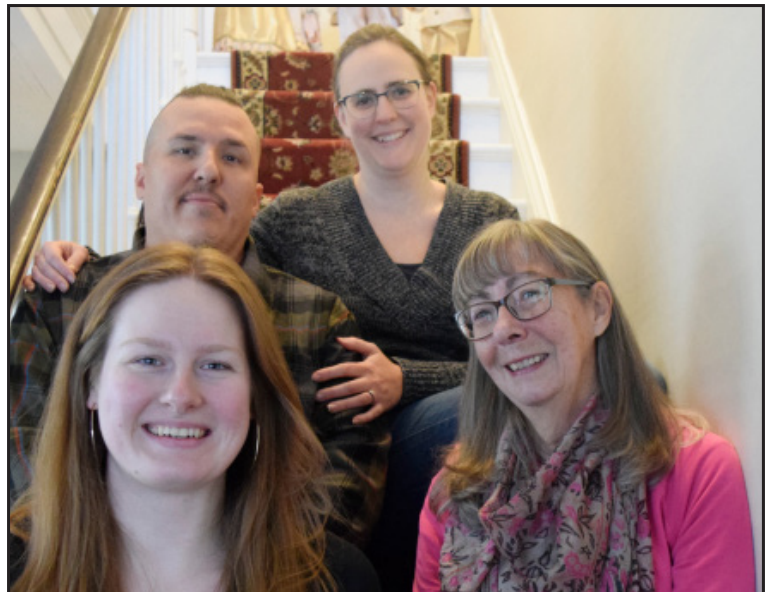
L'équipe de production

L'équipe de création et de production des contenus de L'écho de Compton est formée de professionnels seniors dans leurs domaines respectifs. Le journal a également la chance de pouvoir compter sur plusieurs bénévoles