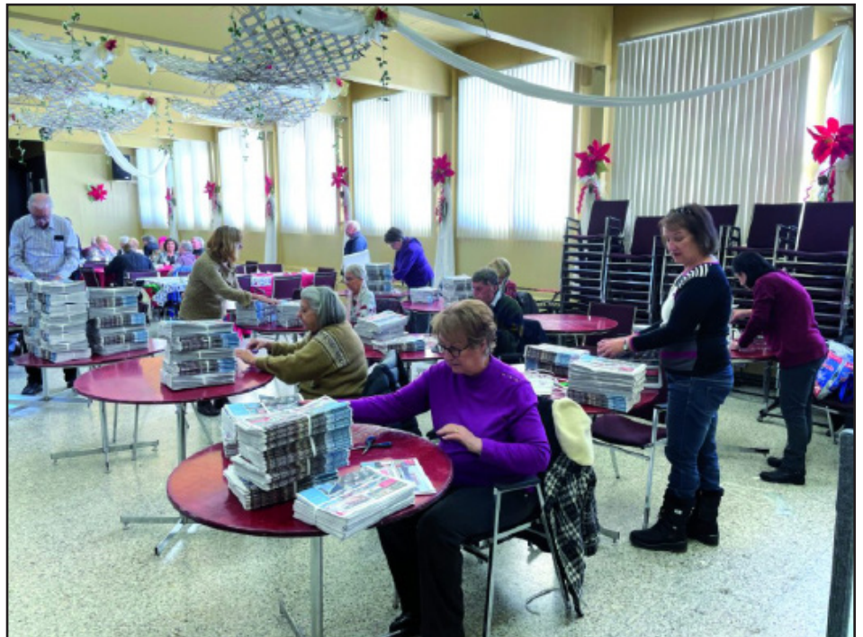
Les bénévoles lors de la distribution du journal (Par Guy Jacques)

Je tiens aujourd'hui à leur adresser mes plus sincères remerciements, car sans ces précieux bénévoles, ce ne serait pas aussi simple ni aussi rapide. Et si certains d'entre vous voulaient joindre leurs rangs, n'hésitez pas à nous contacter!