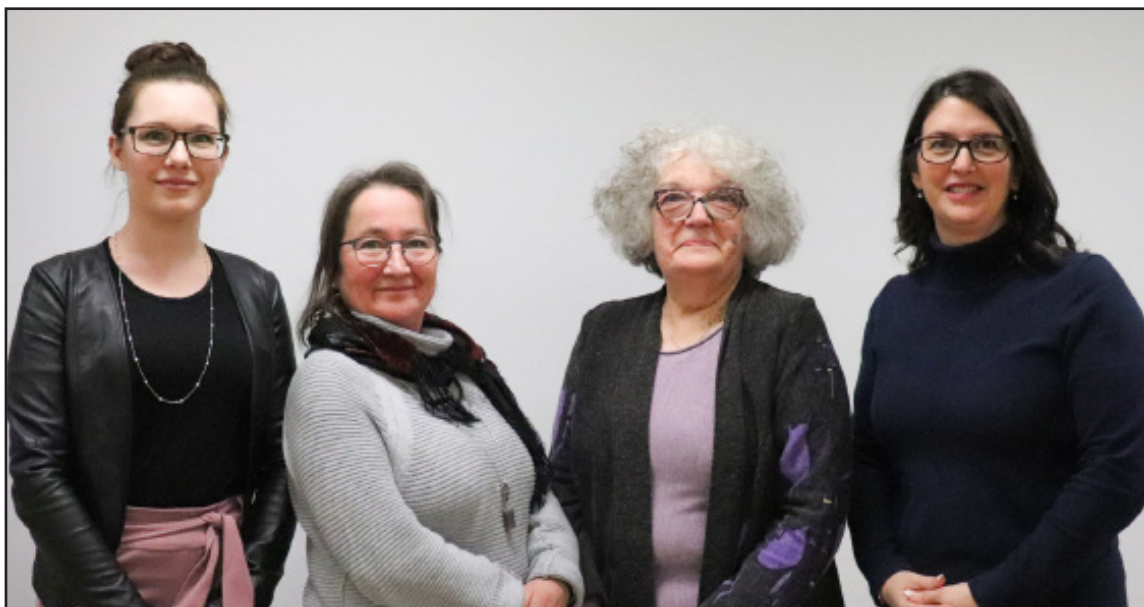
Le conseil d'administration