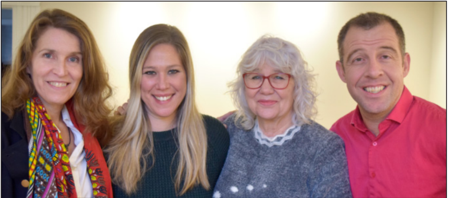
Le conseil d'administration