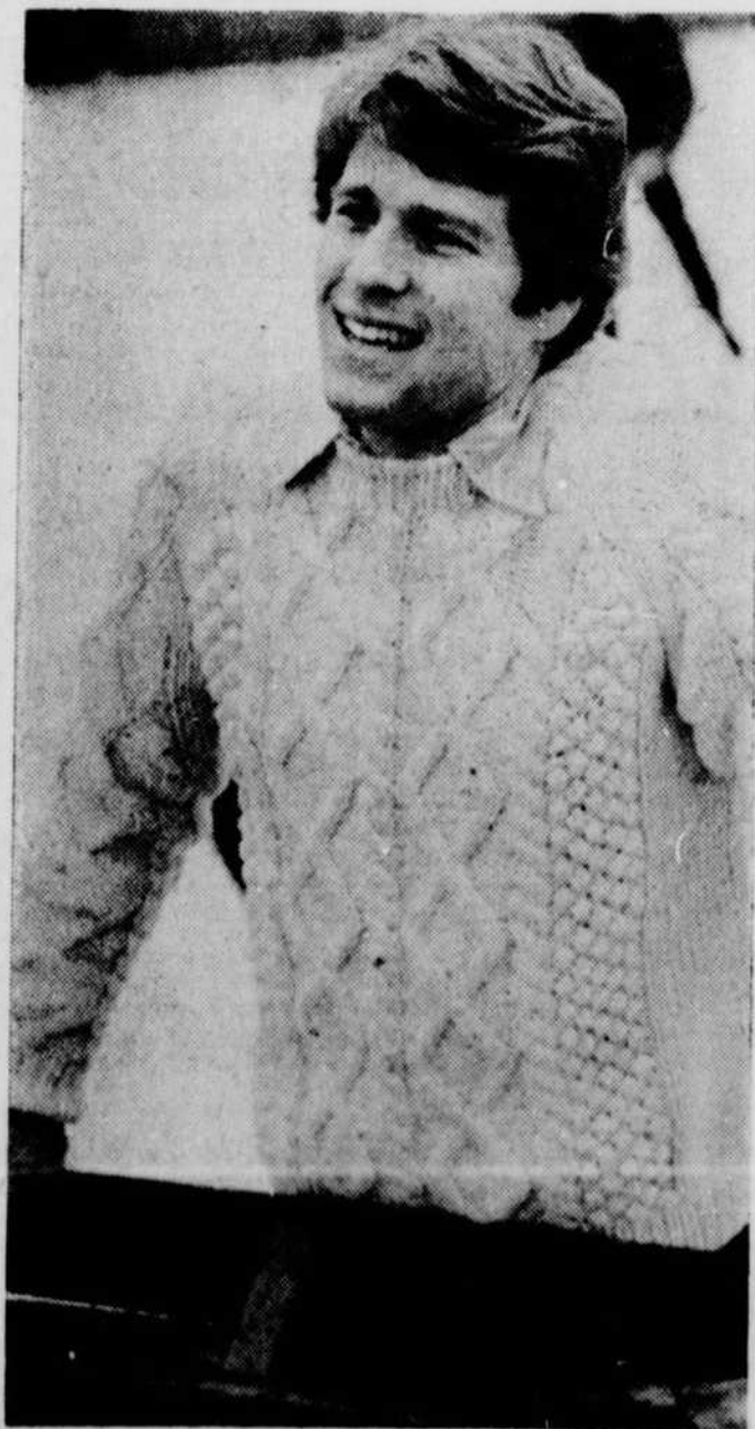
"Love Story" c'est l'histoire d'un amour brisé par la mort. Les interprètes vivent leur personnage avec grâce et un naturel touchants.

ST-ROMUALD — "Les grenouilles" sur semaine à 8.55. Samedi et dimanche à 6.00 et 8.55. "Cinq filles par une chaude nuit d'été" sur semaine à 7.30. Samedi et dimanche à 7.30.