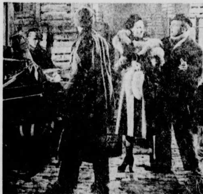
"Quai des Orfèvres" sera le titre du film présenté à l'émission Cinéma le vendredi 10 août à 23h.30. Bernard Blier, Suzy Delair et Louis Jouvet en seront les principaux interprètes. ■