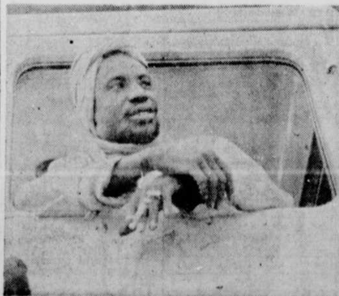
Pour faire suite à "L'Afrique d'hier" qui vous sera présenté aux Beaux Dimanches cette semaine, Radio-Canada vous présentera le 12 à 19h.30 "L'Afrique d'aujourd'hui".