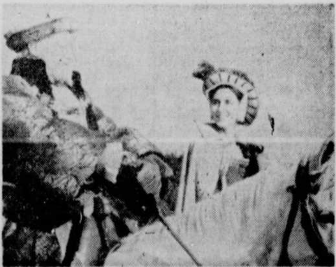
Dans le cadre de l'émission "Hors-séries" débutant à l'automne, vous pourrez voir en six épisodes l'histoire des "Six femmes d'Henri VIII".