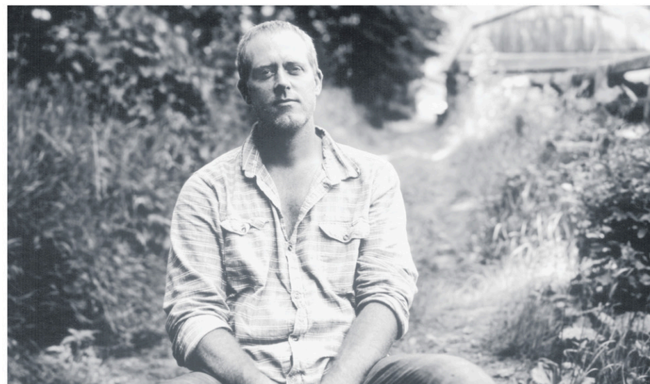
Dans son documentaire La ferme et son État , Marc Séguin met en lumière d'autres façons de faire une l'agriculture écologique, à échelle humaine.

« Au Québec, tous les quotas disponibles sont détenus par l'industrie et on n'a pas le droit de faire plus que 100 poulets hors quotas,