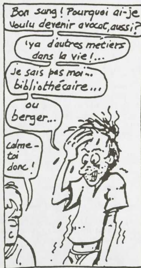
Tiré d'une bande dessinée de Pascal Elie, publié dans le magazine "Maître", vol. 1, no 6, juin 1989

Merci à vous, je vous le rendrai mardi! ■