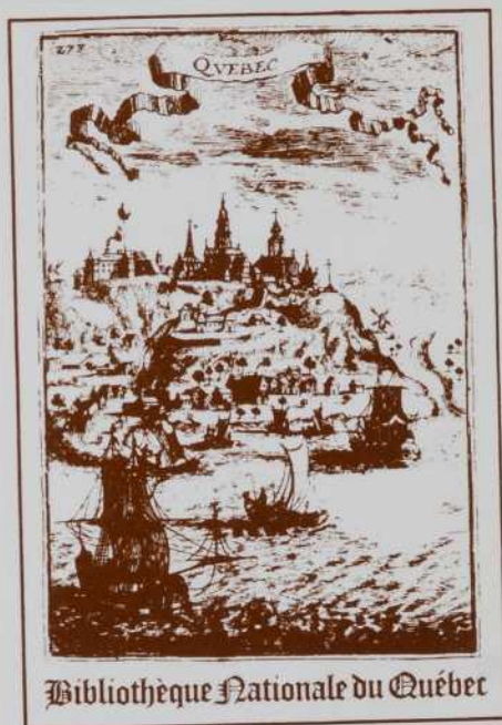
Bibliothèque Nationale du Québec