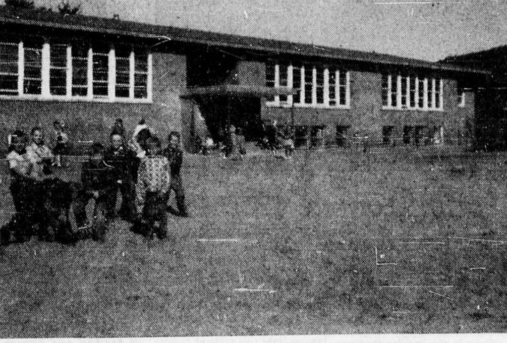
LOCAUX TEMPORAIRES — La photo du haut montre les ruines de l'école séparée Sainte-Anne de Mattawa et donne une idée de l'ampleur des flammes qui l'ont détruite le 16 avril dernier. Dans la photo du bas on voit les locaux temporaires qu'on a aménagés dans la partie épargnée par le feu. C'est la compagnie de construction Boulanger et Tremblay, de North Bay, qui a effectué les travaux de réparations.