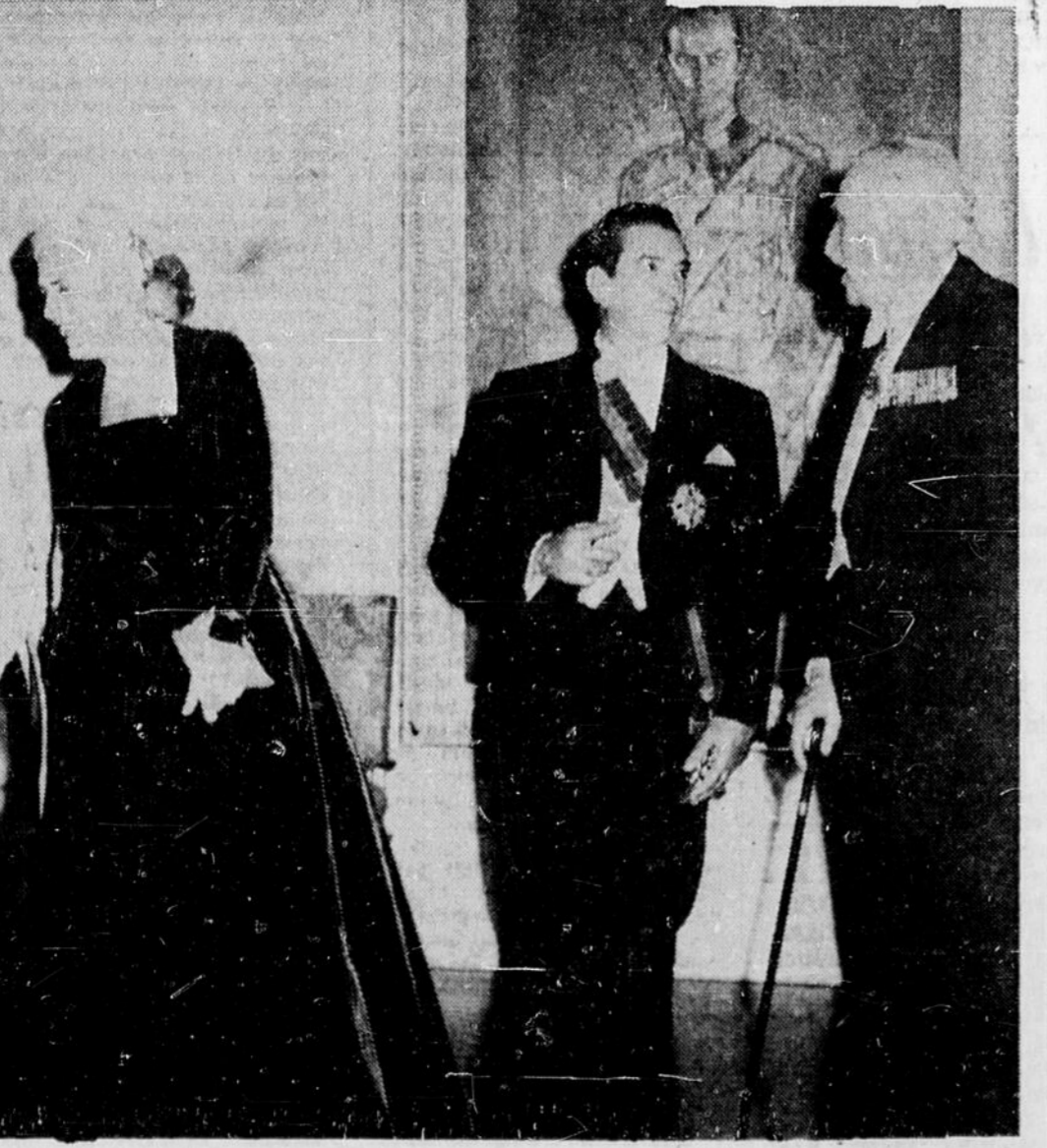
A L'HOTEL DU GOUVERNEUR — M. Adolfo Lopez Mateos, président du Mexique, et son épouse, ont été présentés à plus de 200 invités du corps diplomatique et du gouvernement canadien, lors de la réception qui a suivi le dîner

Le Conseil de ville n'a pas voulu se prononcer au sujet de l'exemption de taxe sur l'édifice de la Légion canadienne. La question sera soumise à un vote des électeurs.