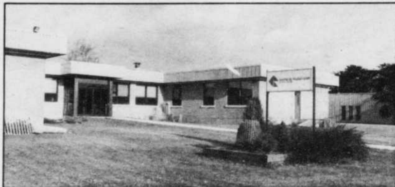
La fondation, vers les années 60, de la Clinique de Réadaptation est sans doute la plus importante réalisation du Club Rotary depuis sa fondation en 1942.

Nous vous appuyons dans votre campagne de vente «Gâteau aux fruits Rotary» pour partager avec ceux dans le besoin.