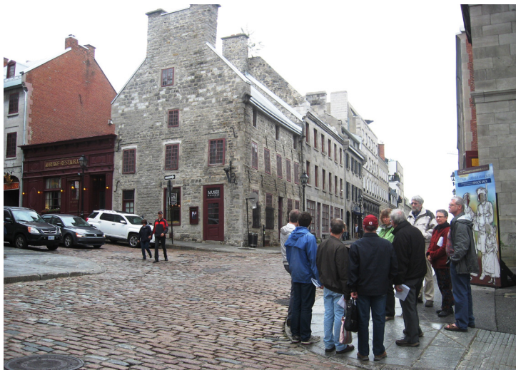
Les participants examinant la maison du Calvet dans le Vieux-Montréal.

Nous nous sommes rendus au square Victoria, témoin du meurtre de Hackett (un orangiste considéré comme un « martyr ») et plus loin, l'emplacement de l'édifice (aujourd'hui démoli) où se sont donnés les premiers