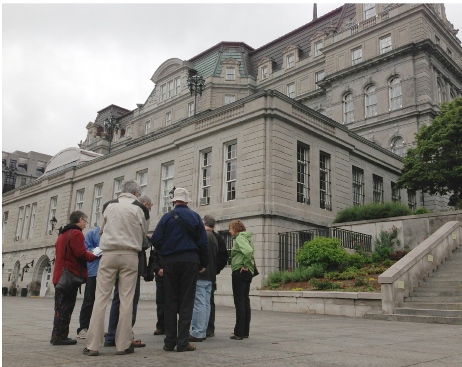
Les participants sur le Champ-de-Mars, situé derrière l'hôtel de ville.

Erskin & American (musée et salle de concert). Il nous aurait fallu deux fois plus de temps, mais les participants ont quand même été enchantés de tout ce qu'ils ont appris au cours de cette visite inhabituelle.