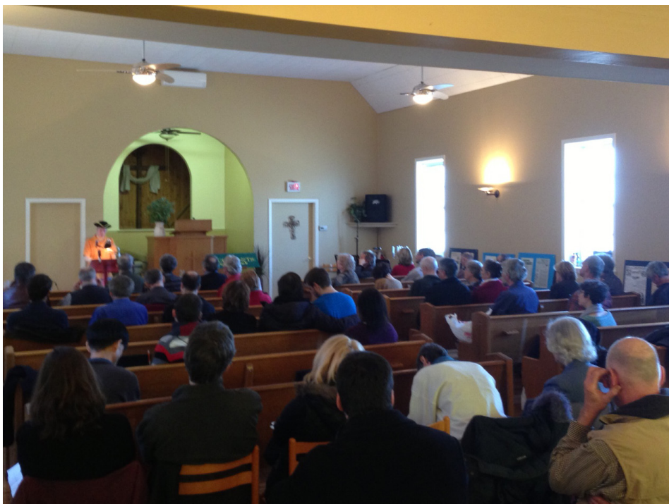
Une partie de l'assistance du matin

Le samedi 6 avril dernier s'est tenu à Québec à l'église réformée baptiste de la Capitale une journée consacrée à l'histoire, reprenant l'idée de journées franco-protestantes suggérées lors du 400 e anniversaire de la ville. Elle avait été organisée localement grâce au concours de Clément Vermet, étudiant à l'Université Laval. L'assistance rejoignait 45 personnes, un peu moins en après-midi. La petite église convenait tout à fait à ce genre de présentation qui de plus a été filmée pour un usage ultérieur.