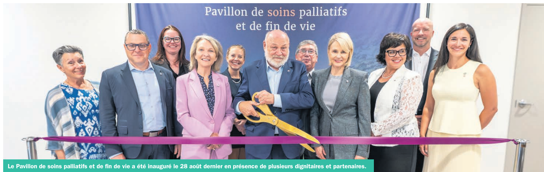
Le Pavillon de soins palliatifs et de fin de vie a été inauguré le 28 août dernier en présence de plusieurs dignitaires et partenaires.