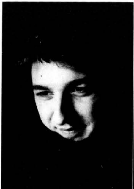
Pierre Lapointe est le nouveau porte-parole de Musiqu'en nous.

L'AUTEUR-COMPOSITEUR-INTERPRÈTE PIERRE LAPOINTE AGIRA COMME PORTE-PAROLE DE LA PROCHAINE ÉDITION DE MUSIQU'EN NOUS QUI SE TIENDRA DU 29 JUIN AU 3 JUILLET.