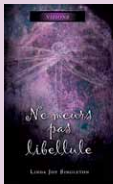
Ne meurs pas libellule , Linda Joy Singleton, Collection Visions (ada), Éditions Ada, 2007, 355 pages